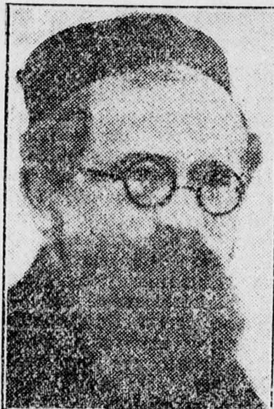
Dr. I. HERCZOG Palesztina grandrabbija

Londonban a legfontosabb napokban hiányoztak a zsidó vezetőférfiak. Weizman Amerikába utazott és Shertok, fontos ügyekben Palesztinába ment. Nem maradt más Angliában, mint prof. Brodetzky, aki a londoni hitközségek központi hivatalát is vezeti, holott állandó elfoglaltsága van Leedsben, egyetemi katedrája székhelyén. Csak hetenkint egy-két napot tölthet Londonban. Shertok rövid ideig tartózkodott Jeruzsálemben, s azután újra visszatért Londonba. Ezzel egyidejűleg Dr. Herzog, palesztinai főrabbi is Londonba utazott repülőgépen. Az országban nagyon fájlatják távozását, ha ez néhány hétre is szól, mivel igen sok és fontos ügyben találta támogatásra a zsidóságot. Sokszáz menekültnek tette lehetővé, hogy partraszállhassanak, különösen a „Hil-