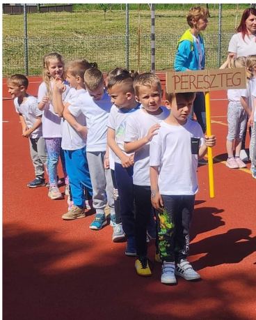
- Csipet csapat -

május 3.-án az év legeszebb ünnepére készültünk. Köszöntöttük az édesanyákat és a nagymamákat. A kis csoportosok az óvónénik segítségével készítették meglepetéseiket, a köszönés meghitt szervezésében az édesapák is kivették részüket. A nagy csoportosok színes műsorral, megható versekkel köszöntötték az anyukákat.