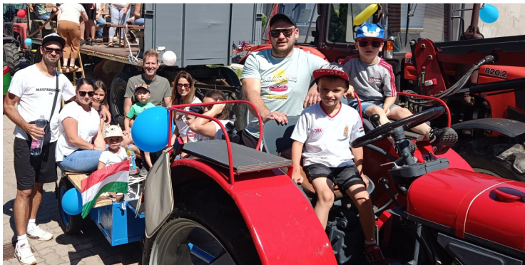
- a Csörgető utca különjárata a traktoros felvonuláson -