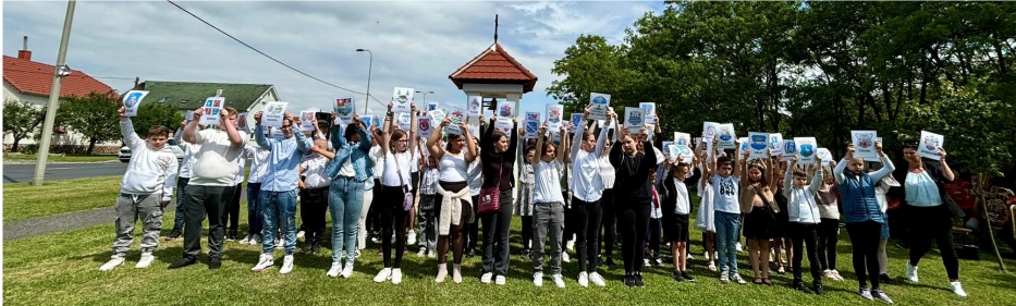
- iskolásaink a 64 vármegye címerével -

dalra táncoltak tanulóink az egykori 64 magyar vármegye címerével, ez nagyon meghatározó volt látni. A műsorban a Hegykői Tűzoltózenekar is közreműködött. Köszönjük az Önkormányzatnak és a résztvevőknek, hogy így együtt ünnepelhettünk.