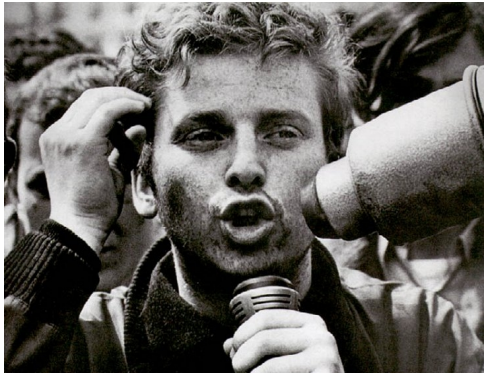
Marc Daniel Cohn-Bendit (1968)

nanterre-i egyetemfoglalás. Az anarchista Marc Daniel Cohn-Bendit vezette csoport később Március 22-e Mozgalom néven vált ismertté. Közben egyre erősebb kampány indult a vietnami háború ellen. Húsvét után a nanterre-i fakultást a dékán bezárta, Cohn-Benditét és két társát május 2-ára a fegyelmi bizottság elé idézték. Május 3-án volt az első nagy tiltakozó gyűlés a Sorbonne-on Cohn-Benditék mellett, ebből nőttek ki az első tömeg-tüntetések, és május 13-ig a vívták a diákok harcukat a rendőrséggel. Az események meglepetésként érték a kormányt és az elnököt is, akik csak egy ismétlődő monom-nak vélték az eseményeket, azaz a vizsgák közeledtével szokásos törni-zúzni jelenségnek, arra gondoltak, hogy a diákok nem akarnak vizsgázni. Pompidou és de Gaulle is elutaztak aktuális hivatalos útjukra. Távollétükben Fouchet, Joxe, Peyrefitte erőszakosan válaszolt a valóban minden várakozást felülmúló tömeg követeléseire. Az elemzés szerint a diáküntetések csak a szikra szerepét töltötték be a mozgalom során, hiszen a dolgozók helyzetének folyamatos romlása állt a háttérben. A tüntetésekhez ettől kezdve a középiskolások és pedagógusok is csatlakoztak.