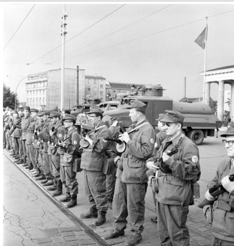
Az NDK munkásőrségének sorfala közvetlenül a szovjet és a brit megszállási övezetek határán a Brandenburi kapu nyugati oldalán

A felvétel 1961. augusztus 13-án készült.