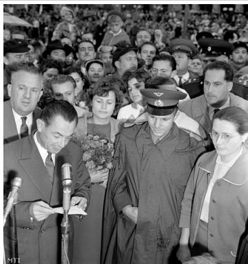
Gagarin és felesége Sztálinvárosban 1961. augusztus 20.

vezetői köszöntötték Gagarint, akit pillanatok alatt hatalmas embertömeg fogott körül. A sztálinvárosi ünnepség után a vendégek folytatták útjukat Pécs felé. Dunaföldváron, Pakson, Bonyhádon és másutt a lakosság zászlókkal, virágokkal vonult ki, s Gagarin az őt köszöntő emberek sorfala között folytatta útját. Pécs határában úttörők várták a diadalkapu alatt az űrpilótát. A megye és a város vezetői szintén a vendégek elé jöttek. A pécs-meszesi asszonyok virágcsóval köszöntötték, a bányászok matyó babát és díszes kivitelű serleget ajándékoztak Gagarinnak. Ettől kezdve csak lépésben tudott haladni a kocsisor, mert a Széchenyi tér felé vezető útvonalat ezrek lepték el: az ünneplők sokasága között alig tudtak helyet biztosítani a motoros rendőrök. A pécsi Széchenyi tér zsúfolásig megtelt, ahol a vendégek néhány percre megszakították útjukat .