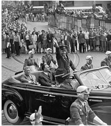
Gagarin a Mártírok útján (ma: Margit körút) integet az embereknek.

A gépkocsiban Kállai Gyula miniszterelnök-helyettes