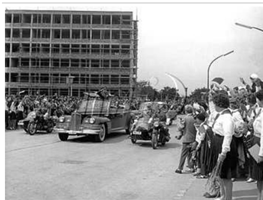
Úttörők üdvözlik az érkező Gagarin őrnagyot. Pécs-Mecsekalja, 1961. augusztus 20.

Az út következő állomása az új-mecsekaljai bányászvárosrész volt, ahol a lakosság szintén lelkesen fogadta Gagarint és feleségét. A küldöttség rövid pihenőt tartott az Olimpia Étteremben, majd tovább indult Komlóra, az „országjárás” végcéljához, ahol tovább folytatódott a protokolláris ünnepség.