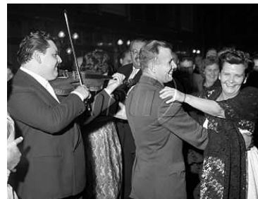
Gagarin Kádár János feleségével táncol azon a fogadáson, amelyet a Magyar Népköztársaság Elnöki Tanácsa adott Gagarin tiszteletére a Parlamentben Budapest, 1961. augusztus 21.