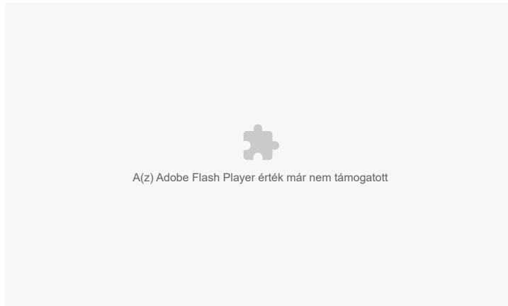
Az összeírt községek és városrészek kategóriánként.

Az Országos Tervhivatal, a Munkaügyi Minisztérium és a Központi Statisztikai Hivatal által jegyzett előterjesztés a „népszéírás” indokaként felhozta, hogy az éves és a távlati tervek elkészítése során egyre több és komoly problémát okozott az a tény, hogy a népesség számát és összetételét tükröző statisztikai adatok részben elavultak, részben pedig egyáltalán nem állnak rendelkezésre. A népesség száma és összetétele már „az ellenforradalmi események előtti időkben sem volt teljességében és részleteiben ismert”. 1949 elején történt a legutolsó népszámlálás, melynek területi és foglalkozási adatait a nagyarányú társadalmi és gazdasági változások miatt már nem tudják használni. A Központi Statisztikai Hivatal a népszámlálási adatok folyamatos vezetése és korrigálása során „adathiányra való tekintettel” nem tudta figyelembe venni a népszámlálás után történt legális és illegális külföldre távozásokat. Az akkor a távozottak számát „több tízezerre” becsülték