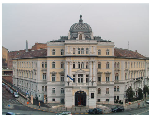
A KSH főépülete a budapesti Keleti Károly utcában

A népgazdaságon belül olyan további belső mozgások folytak le, amelyek főleg a foglalkoztatottság megoszlásának vizsgálatánál okoztak nehézségeket, ugyanis tízezrekre volt tehető azoknak a bérből és fizetésből élőknek a száma, akik a mezőgazdaságba távoztak, és ott találták meg életlehetőségeiket. A termelőszövetkezetek egy része feloszlott és az ott dolgozók a mezőgazdaság magánszektorába mentek. Nagymértékben csökkent a fegyveres erők létszáma is. Növekedett a nem mezőgazdasági magánszektorban dolgozók száma. A külföldre távozás az ország népességének területi megoszlásában - és egyéb vonatkozásaiban is - újabb, jelentős eltolódásokat okozott. Az előterjesztés szerint ezért nincs elég adat a népgazdaság tervezéséhez (hároméves terv ellenőrzéséhez, ötéves terv elkészítéséhez, ezeken belül a munkaügyi tervezéshez), sőt, az „M” - katonai, hadikészletoző - tervek elkészítésének alapjai is hiányoznak.