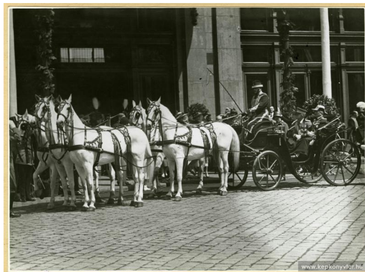
Az olasz király látogatása Budapesten: a Keleti pályaudvarnál a hintóban az olasz király és Horthy kormányzó (Forrás) [4]

A kiszűrendő csoportok közül a legnagyobb terjedelemben a Szerb-Horvát-Szlovén Királyságbeli, illetve jugoszláv állampolgárokkal, továbbá a vélelmezhetően onnan származókkal foglalkoznak a rendeletek. Mi lehet ennek a kiemelt figyelemnek az oka? A magyar külpolitika, nevezetesen Horthy Miklós kormányzó 1926-ban, a mohácsi csata 400. évfordulóján mondott beszédében még a magyarok és szerbek barátságáról, szövetségéről, együttes törökellenes harcáról beszélt. Ez egyértelmű nyitás volt a Szerb-Horvát-Szlovén Királyság felé, amely ezt örömmel fogadta. Ugyanakkor a közeledés felkeltette az olasz diplomácia figyelmét, amely igyekezett megakadályozni a bimbózó kapcsolat elmélyülését. Így végül a Magyar Királyság nem szomszédjával, hanem Olaszországgal kötött barátsági szerződést 1927-ben. Innentől kezdve évről évre mélyültek a magyar-olasz kapcsolatok: Gömbös Gyula miniszterelnök első útja Rómába vezetett, majd 1934 márciusában - Ausztriával kiegyezülve - aláírta az ún. római jegyzőkönyvet.