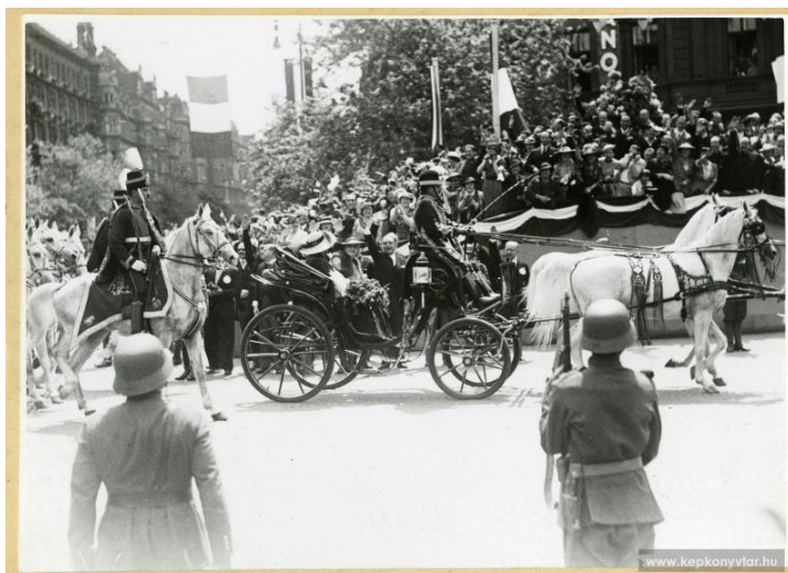
III. Viktor Emánuel, olasz király látogatása Budapesten (Forrás) [2]