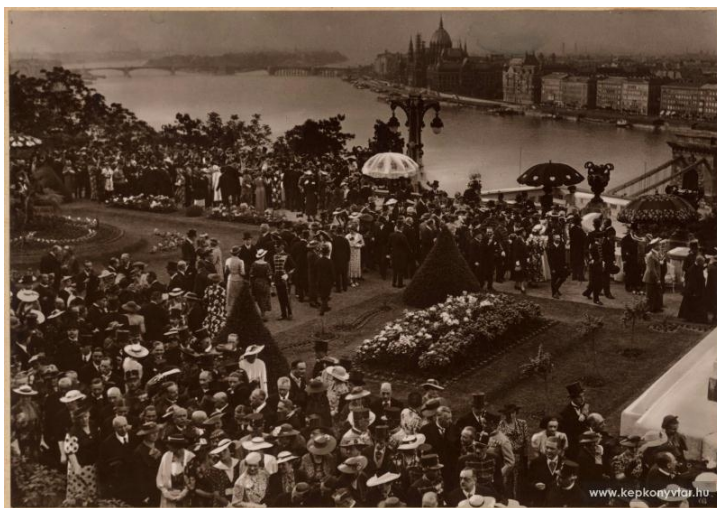
Az olasz királyi pár tiszteletére rendezett ünnepség a Városliget kertjében [5]

A merénylet utáni nyomozásban csakhamar Magyarország került a nemzetközi sajtó és politikai érdeklődés középpontjába. Mivel az ügy számai messze, több fővárosba is elvezettek, a magyar kormánynak - Róma és London támogatásával - sikerült elérnie, hogy a Népszövetség Tanácsa nem hozott elmarasztaló ítéletet Magyarország ellen. Az úgy „salamoni” befejezéseként Budapestre bizta az érintett magyar szervek felelősségének megállapítását és megbüntetését. A marseilles-i merénylet átmenetileg súlyos nemzetközi elszigeteltségbe taszította Magyarországot, és még jobban összekovácsolta - még ha csak provizórikusan is - a kisantant egységét. Mindez abban a kontextusban értelmezendő, hogy az emigráns usztasa vezetés éppen Olaszországban élt, s így Róma esetleges felelősségének kérdése sem lett volna megkerülhető egy komoly nemzetközi vizsgálat esetén. Az olaszok magatartása ezután is kétarcú maradt, hiszen a marseilles-i merénylet után letartóztatták az usztasa vezetőket, de néhány nap után valamennyiüket szabadon engedték. Ezt követően kiutasították az usztasákat - erről a magyar belügy „bizalmas forrásból” időben értesült -, egyszersmind azonban megtagadták kiadásukat Jugoszláviának.