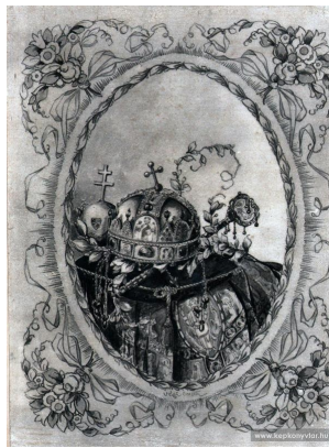
Az Érdekes Újság koronázási számának címlapja