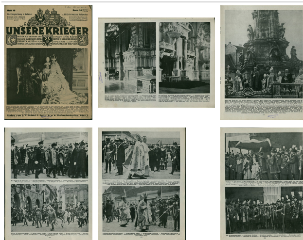
Az Unsere Krieger (többnyelvű, képes magazin) koronázási kiadása

A Szent Koronát a Magyar Nemzeti Múzeum (MNM) részéről még a ceremónia előtt tudományos szempontból megvizsgálták azért, hogy kiderüljön, hogy van-e szükség a belső bélelés bármilyen átalakítására. Még két nappal korábban, december 28-án a Várpalotában Károly felpróbálta a koronát, és miként azt az MNM jelentése megállapítja: a „ korona tetemes bősége eleve kizárja annak bélés nélkül lehető használatát s a belső rész nyers kidolgozottsága is arra vall, hogy ahhoz kezdettől fogva sapka alakú bélést szántak. ” Az 1867-es koronázáskor beletett bélelést, amely egy aranszövetből készült bélésből és egy selyembevonatú parafa abroncsból állt, ekkor eltávolították. Az utólagos pótlás nem sikerült tökéletesen, és a ceremónia során a nem megfelelő illeszkedés következtében a korona többször is instabilnak tűnt a frissen koronázott király fején, ezt később többen baljós előjelként értelmezték.