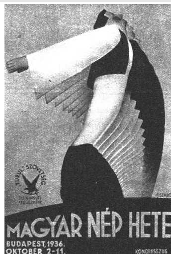
A Magyar Nép Hete plakátja

Nemzeti Újság, Képes Melléklet, 1936. augusztus 2.