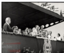
Kádár János Győrben, 1959. augusztus 20. (képgaléria) [2]

A harmadik levélváltás a következő évből, 1959-ből való. Békéscsaba római katolikus káplánjának levele „tömény dicshimnusz”, és megírására alkalmas Kádár János augusztus 20-ai győri beszéde szolgáltató. A káplán ezzel kapcsolatban szuperlatívuszokban méltatta az MSZMP első titkárának (és nem főtitkárának, ahogy a káplán szólította) retorikai képességeit, egyben államvezetési kvalitásait. A maga tevékenységére rátérve adta Kádár Jánosnak tudtul, hogy milyen politikai szervezetekben „vitte előre” „hazánk szocialista építő munkáját”. Hozzátette: „Ezért semmiféle kitüntetést, különös megbecsülést nem kívánok, hiszen amit én, mint pap adhatok, olyan csekélység például pl. egy bányász vagy egy gyári munkás építő munkája mellett, hogy szinte eltörlőd, és említésre sem méltó. De mégis az érzélem és a szív világában eljegyeztem magam a dolgozó nép ÁLLAMÁVAL [kiemelés az eredetiben - K. Cs.], mely értünk, mindnyájunkért van, s mely általunk fejlődik, szépül és virul.” Nem felejtette el megemlíteni, hogy az alkotmányról („ALKOTMÁNY”) ő is megemlékezett szentmisei szentbeszédében. Végeredményben nem kívánt semmilyen problémájára orvoslást, nem kért, igényelt semmit, csupán a gratulációit fejezte ki. Levelét nagy betűkkel gépírt, a Szovjetuniót, Hruscsovot, a „békétábrót”, stb. dicsőítő mondatokkal zárta le. Kádár e levélre is rendkívüli lakonikussággal válaszolt: szintén csak köszönetet mondott és minden jót kívánt.