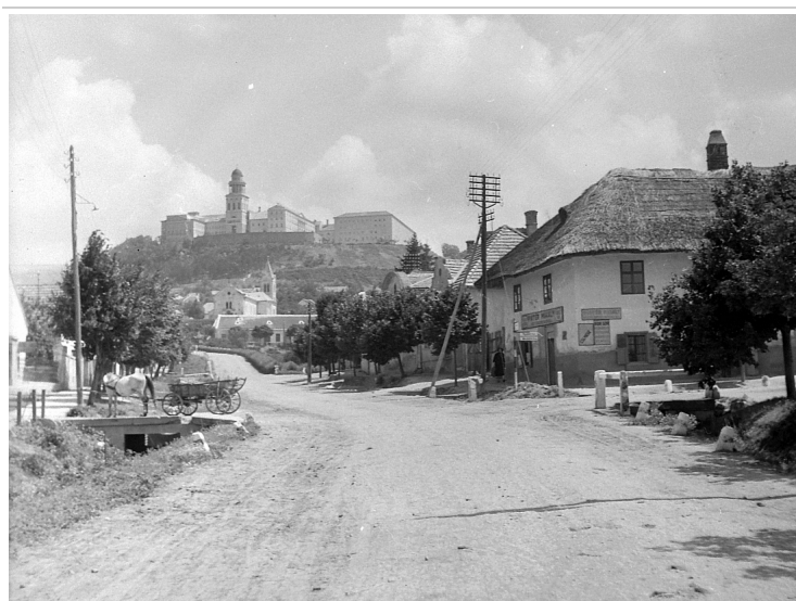
Pannonhalm az 1940-es években