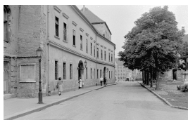
Hess András tér, háttérben a Fortuna utca és a Magyar Országos Levéltár (1950-es évek)