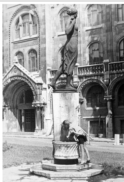
Bécsi kapu tér, Kazinczy emlékkút, a Magyar Országos Levéltár épülete (1950-es évek)