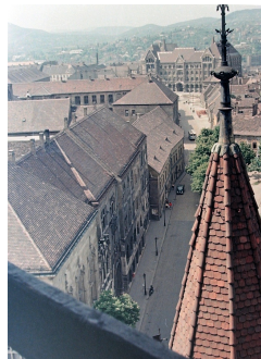
Fortuna utca, háttérben a Magyar Országos Levéltár épülete (a Mátyas templom tornyából fotózva) (1957)