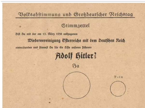
Szavazólap 1938. április 10-én

Az osztrák püspöki kar pozitív, az egyház érdekeit védeni próbáló állásfoglalása mellett a szociáldemokrata Karl Renner , korábbi kancellár és későbbi szövetségi elnök Anschluss-párti nyilatkozata is illúzióknak bizonyult. A diktatúra mindennapjai, a Gestapo megjelenése, a vezető posztok átadása a Birodalomból érkezetteknek bizonyos kijózanodást eredményeztek. A legkülönbözőbb világnézetű emberek, főleg kommunisták, szocialisták, katolikusok és legitimisták, nagyrészt jól képzett fiatalok részvételével kisebb ellenállási csoportok, és külföldi emigrációs központok alakultak. Ugyanakkor - és ezt Ausztria, ahogy ez az osztrák szövetségi elnök közölt beszédéből is kitűnik, hosszú évtizedeken át próbálta kiiktatni a nemzeti emlékezetből - a Wehrmachtban 1,25 millió osztrák harcolt, minden negyedik felnőtt osztrák az NSDAP lelkes tagja lett, a fajgyűlölet áldozatairól nem is beszélve.