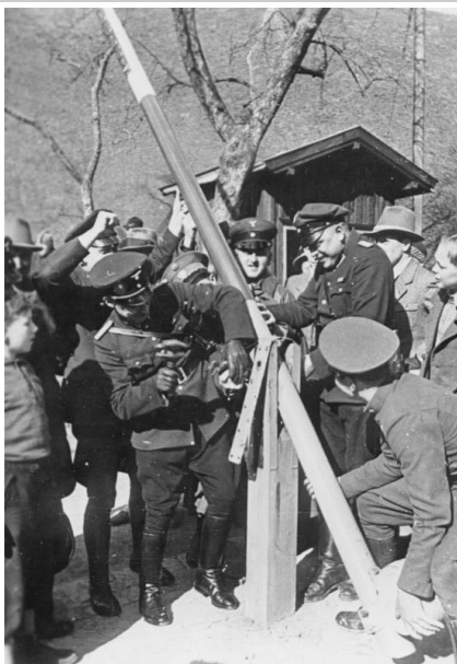
Német és osztrák határőrök a határállomást bontják

A hitleri feltételekkel megvalósuló anchluss-szal szembeni egységes fellépésre nem volt esély, mert az ország az 1927. július 15-én, az Igazságügyi palota előtt történtek, egy munkástüntetés mintegy kilencven halálos áldozattal járó leverése óta egymással kibékíthetetlenül szemben álló táborokra szakadt, majd megkezdődött az a fokozatos államcsíny, mellyel a Dollfuss-Schuschnigg kormányzat megfojtotta a köztársaságot. A náci esélyeit jelentősen növelte, hogy a kormány 1934 februárjában leszámolt a szociáldemokratákkal, így belső bázisa is megfogyatkozott. Mégis az osztrák hivatásrendi állam volt az első államilag szervezett résistance-mozgalom Európában. A deklaráltan antidemokratikus, a politikai katolicizmust zászlajára tűző rendszer védekezési kényszerből, a külpolitikai szövetségkeresés sikertelenségének belátásából született, és a nemzetiszocializmus általi fenyegetettséggel, a „nemzeti” ellenzékkel szemben kívánt megfelelő, „hazafias” ellenmodellt nyújtani. Hitler hatalomra jutásakor az osztrák lakosság kétharmada minden pártpolitikai ellentét dacára az osztrák államhoz tartozónak vallotta magát.