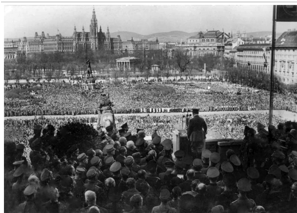
Hitler beszédet mond a Heldenplatzon