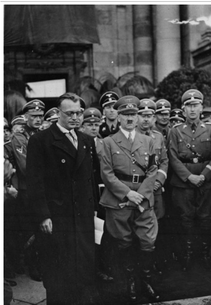
Seyß-Inquart és Hitler Bécsben, 1938. március

Hitler 1938. február 12-én megbeszélésre hívta az osztrák kancellárt. Schuschnigg később úgy emlékezett, hogy az egyik oldal „ nagyon hangosan beszélt, anélkül, hogy ordított, a másik halkabban, anélkül, hogy suttogott volna ”. Hitler három napos ultimátumot adott át az ideigleg amúgy sem erős kancellárnak, melyben az osztrák kül-, hadügyi, gazdaság- és sajtópolitikának a némethez történő igazítását, a náci szabad ténykedésének biztosítását, és Arthur Seyß-Inquart belbiztonsági miniszteri kinevezését követelte. Mivel az osztrák államapparátust egyre inkább ellepték a náci szimpatizánsai, és a nyugati hatalmak tehetetlensége sem változott, az osztrák kormány csak az időnyerésre építhette politikáját. Ám a berchtesgadeni egyezmény sem hozta el a remélt megnyugvást, hanem még inkább előmozdította a két állam közeledését.