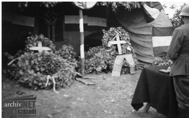
20. Nagy Géza ravatala