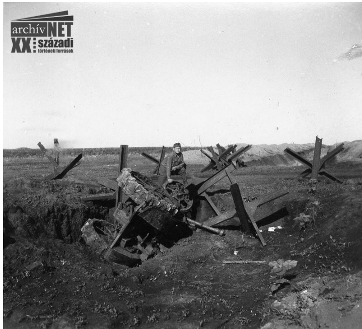
15. M3 Stuart könnyűharcoski roncsa