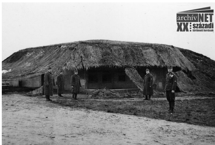
12. Álcázott orosz erőd a Sztálin-vonalban