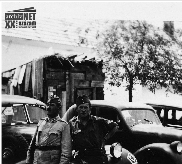
11. Valahol a front mögött