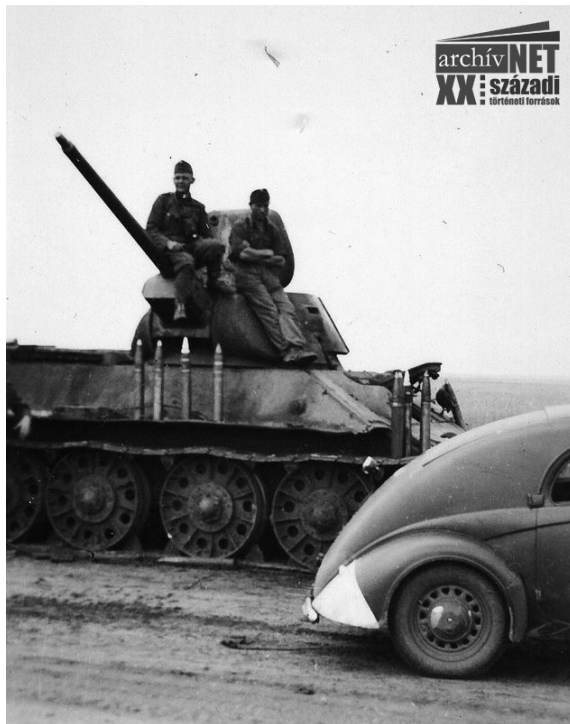
14. T-34 harckocsi az út szélén