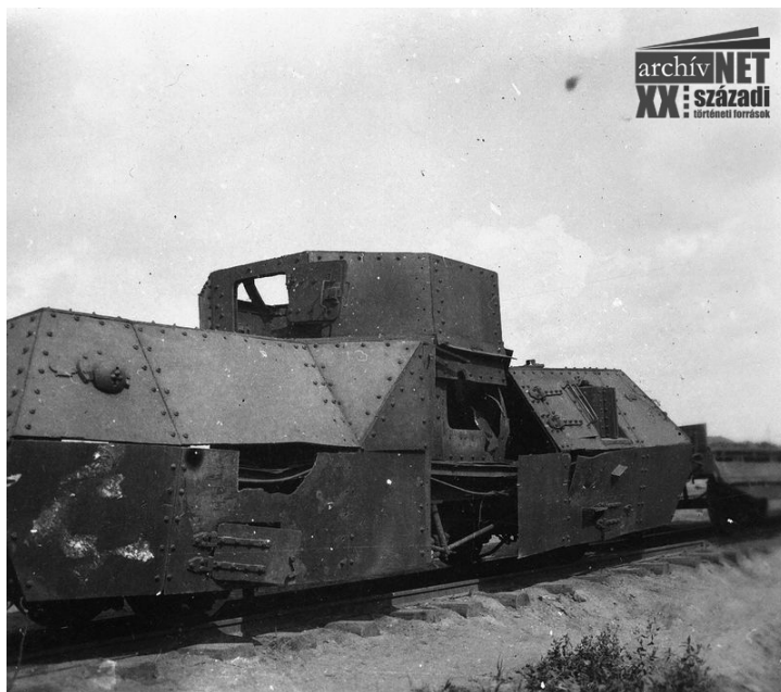
06. Elhagyott páncélvonat