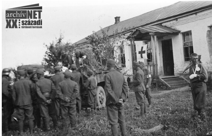
07. Segélyhely a front mögött