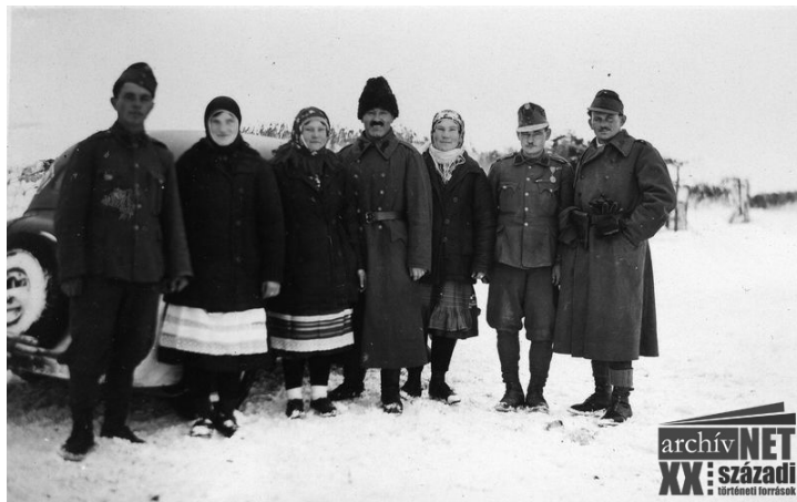
26. Megjött a tél