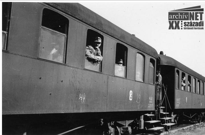
01. Úton a frontra 1.