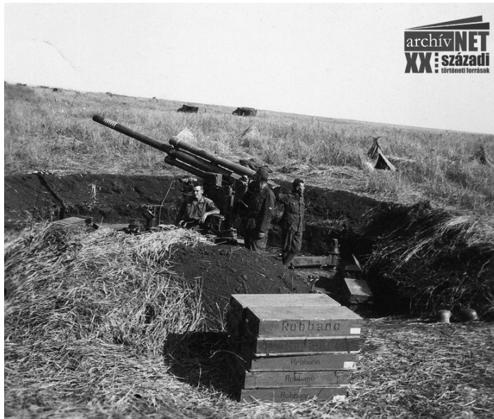
13. 5/8M magyar légvédelmi löveg