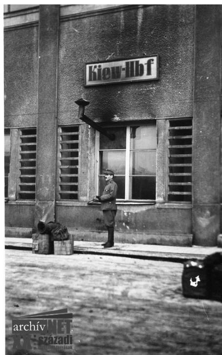
03. A kijevi főpályaudvaron