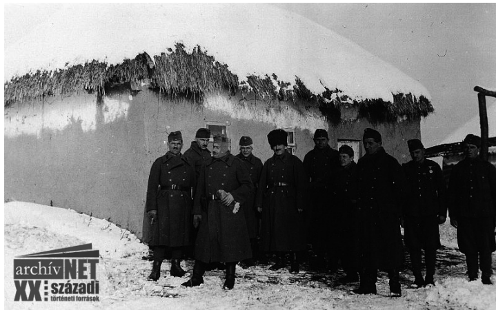
27. Megjött a tél