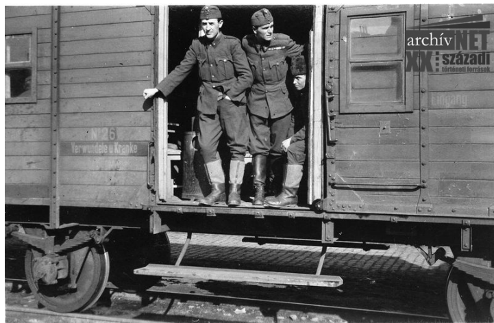
02. Úton a frontra 2.