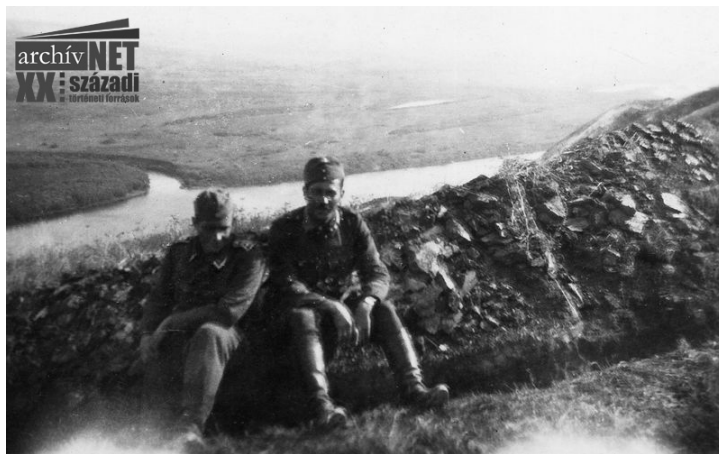
16. A Don partján