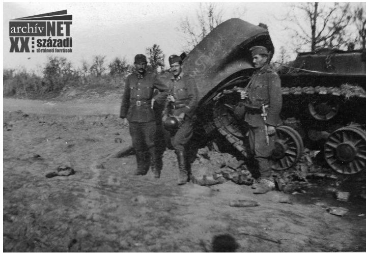
18. Sztorozsevoje, 1942. október 5.