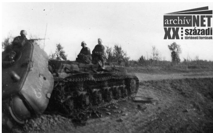
17. Sztorozsevoje, 1942. október 5.