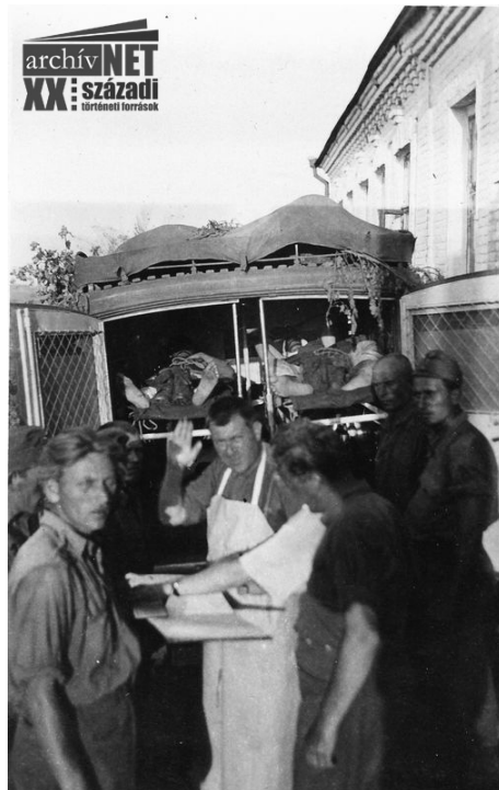
09. Meghózták a sebesülteket