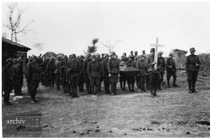
19. Nagy Géza ezredes koporsója