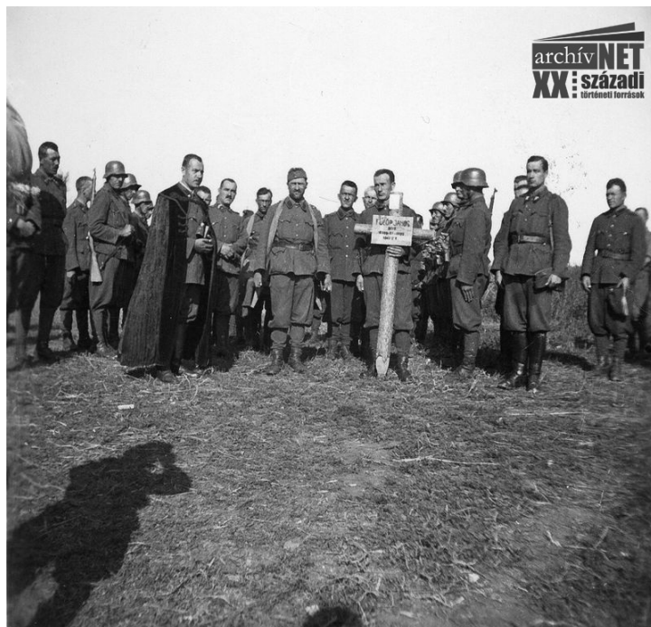
22. Temetés a Don-kanyarban