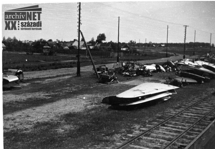
05. Orosz zsákmányanyag a sínek mentén