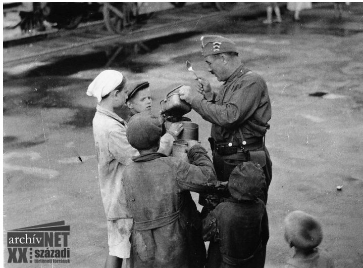
04. Ételosztás Orelban