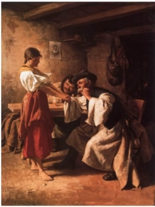
Révész Imre: Udvarlók / Egy kérdés (1881)