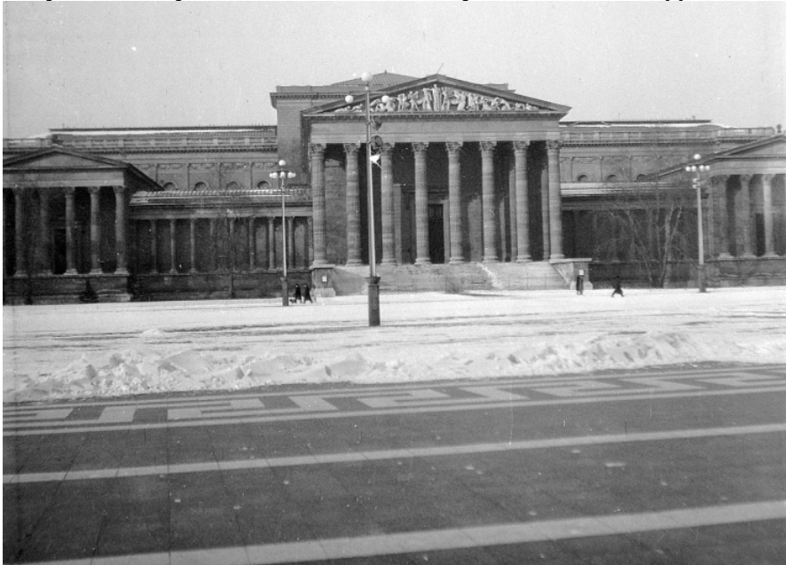
Hősök tere, Szépművészeti Múzeum, 1943 [2]

Az ország legjelentősebb művészeti értékeit őrző múzeumban, a Szépművészeti Múzeumban az év során egyre több különleges értékű gyűjteményt helyeztek el. Ide kerültek a legértékesebb zsidó tulajdonú műkincsek, és e múzeumban helyezték biztonságba a keresztény gyűjtők is (arisztokraták, nagypolgárok) saját, értékes műgyűjteményüket. A múzeum alagsorát a biztonság fokozása érdekében kibővítették, míg felső emeletét kiürítették.[4]