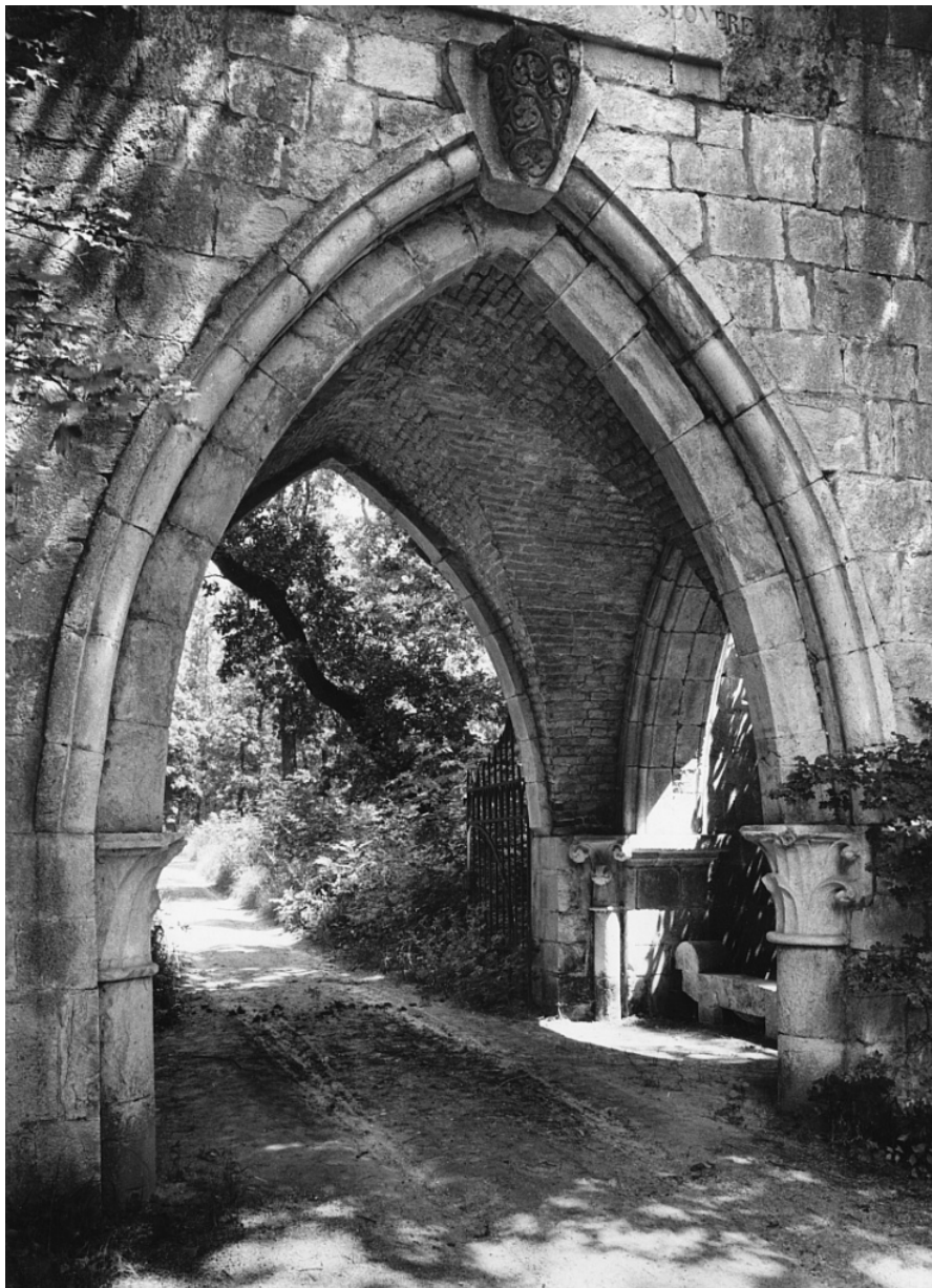
Az Esterházy-kastély parkja, Csákvár, 1940