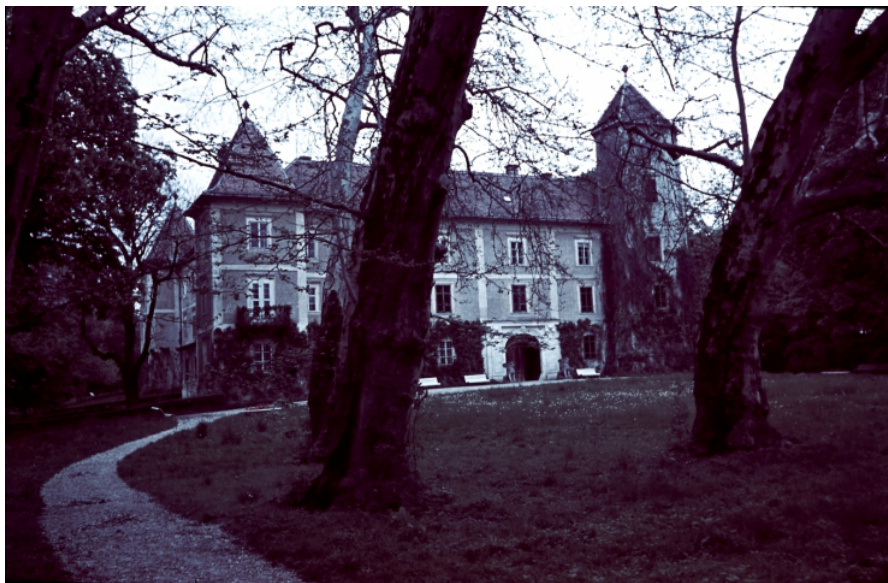
Khuen-Héderváry kastély, Hédervár, 1940

A Bizottság által a hédervári Khuen-Héderváry-kastély értékeinek megmentésére kiküldött megbízott három alkalommal utazott személyesen a kastélyba, 1945 szeptemberében két alkalommal, majd december elején ismételt. Míg szeptemberben a kastélyban rendezett körülmények látott (az épületet a szovjet hadsereg kórháznak használta), addig decemberben már merőben különböző állapotot észlelt. „Először is kb. hat hete az orosz nemibeteg kórházat elszállították és harcoló [!] csapatok foglalták el a kastélyt. Amit még a legutóbb is jelentettem, annak most mind az ellenkezőjét tapasztaltam. Szeptemberben mind az orvosok, mind a betegek gondosan vigyáztak a könyvekre és a belső berendezésre. Akkor mindent teljesen ép állapotban találtam és hagytam el. Jelenleg a könyvszekrényeket tüzelik (a kastély berendezésével, a történelmi értékű empire-bútorokkal[15] fűtenek), a megmaradt könyveket a legnagyobb szekrénybe teljes összevisszaságban 4-es és 5-ös sorokba belenyomkodták, s ezáltal a finom aranynyomámos bőrkötések feltépődtek, a papíryanag erősen megrongálódott, s ami a legelkeserítőbb, az első alkalmakkor a könyveket 100%-os épségben találtam, most pedig becslésem szerint a még ott maradt könyvek 10–15%-a, gondolom, a fűtés martaléka lett” – írta a megbízott 1945. december 15-én, hozzátéve azt is, hogy szeptemberben az egész anyagot el lehetett volna szállítani.