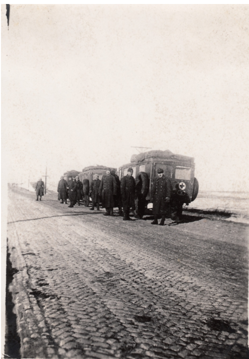
12. A IV/2. sebesültszállító gépkocsioszlop Harkovba tartó gépjárművei pihenőt tartanak útközben, 1942. november-december