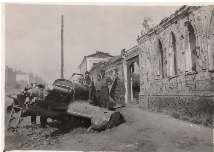
10. A IV/2. sebesültszállító gépkocsioszlop honvédjei egy lelőtt szovjet vadászpilóta roncsaival Osztrogozsszokban, 1942. augusztus elején