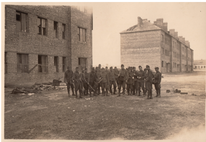
17. A IV/2. sebesültszállító gépkocsioszlop szálláscsináló honvédjei egy elhagyott szovjet laktanyában Ovrucsban, 1943. március 10. körül