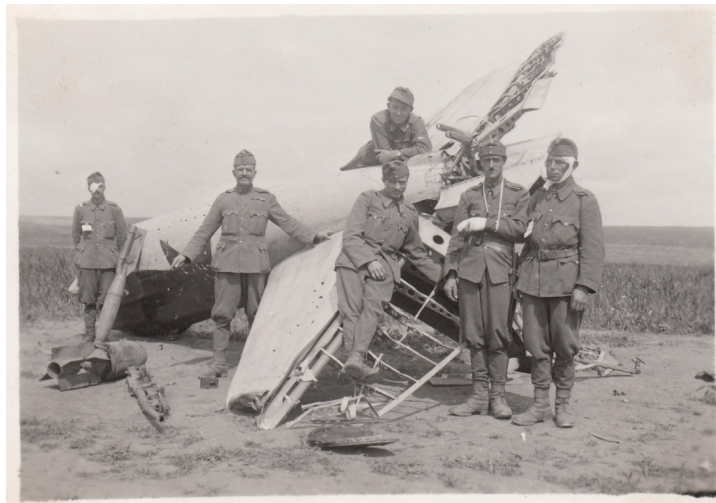
6. A IV/2. sebesültszállító gépkocsioszlop honvédjei bekötözött sebesültekkel egy lelőtt szovjet vadászpilóta roncsainál Kraszno Lipjén, 1942. július 18-án