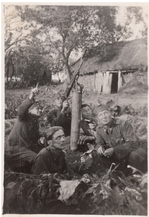
8. A IV/2. sebesültszállító gépkocsioszlop katonái egy légvédelemre beállított 31 M. 8 mm-es golyószóróval Osztrogozsszokban, 1942 augusztusának elején