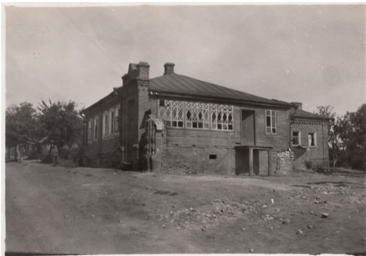
11. A IV/2. sebesültszállító gépkocsioszlop parancsnokságának épülete légitámadás után Osztrogozsszokban, 1942. augusztus 8-án