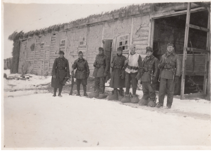
14. A IV/2. sebesültszállító gépkocsioszlop téli védőfelszerelést viselő honvédek járműveik téli garázsa előtt Krasznojében, 1942. november-december