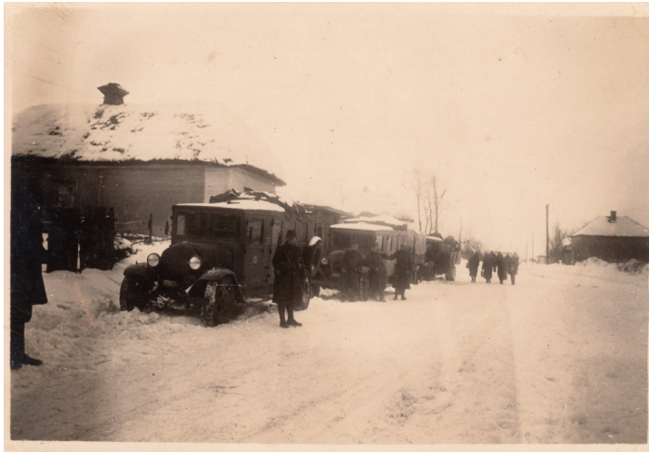
15. A IV/2. sebesültszállító gépkocsioszlop megmaradt járművei visszavonulás közben Szirovatkán, 1943. február 9-én