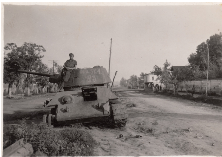
9. Német utcanév-táblának használt, kilőtt szovjet T-34-es közepes harckocsi Osztrogozsszokban, 1942 augusztusának elején