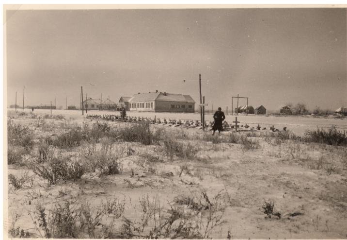
13. A magyar honvédek hősi temetője Krasznojében, 1942. november-december