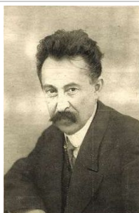
Bokányi Dezső munkaügyi és népjóléti népbiztos