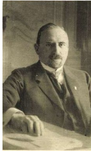
Ágoston Péter külügyi és igazságügyi népbiztos