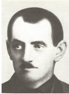
Bajáki Ferenc szociális termelési népbiztos