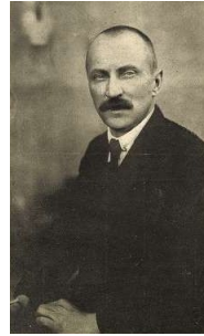
Dovcsák Antal szociális termelési népbiztos

Az egykori, alapvetően szociáldemokrata érzelmű népbiztosok egy kivétellel (Dovcsák Antal) meg voltak győződve az ártatlanságukról. Nem ismerték fel az ellenforradalmi rendszer természetét és nem hitték, hogy politikai tetteikért letartóztatják, és bíróság elé állítják őket. Dovcsák Antal ugyanis a Tanácsköztársaság bukása után bujkált, rejtékhelyéhez egy csomag vezette el a házáat folyamatosan megfigyelő rendőrt. A Kommunista Magyarországi Pártjának egyik alapító tagját Vántus Károlyt korábbi földművelésügyi népbiztosot 3,5 hónapos bujkálás után 1919. október 14-én a nagykorúti Meteor szállóban tartóztatták le. Kelen József szociális termelési népbiztosot pedig Bécsbe való szökése során Sopronban fogták el, és szállították vissza Budapestre. Miután az elérhető egykori népbiztosokat őrizetbe vették, a rendőrség házkutatást tartott lakásaikban, melyeket zár alá vettek, ingóságait pedig lefoglalták.