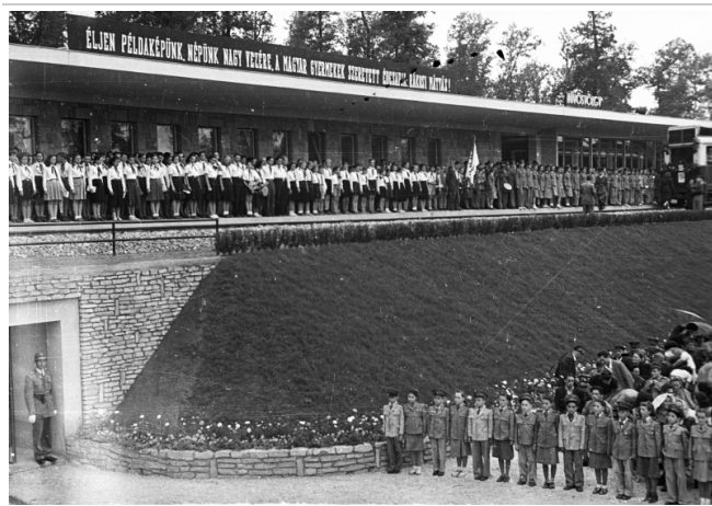
Hűvösvölgy, a Gyermekvasút (Úttörővasút) végállomása. Ünnepség a teljes vonal átadása alkalmából. (1950)

A cserkészet tervezett tartalmi-pedagógiai pozitívumainak átvételére nem került sor, hiszen Rákosi, illetve a kommunista vezetés számára a gyermekszervezet is hatalmi kérdés volt, amit miután teljesen maga alá gyűrte, csak saját propagandisztikus céljaira használt fel.