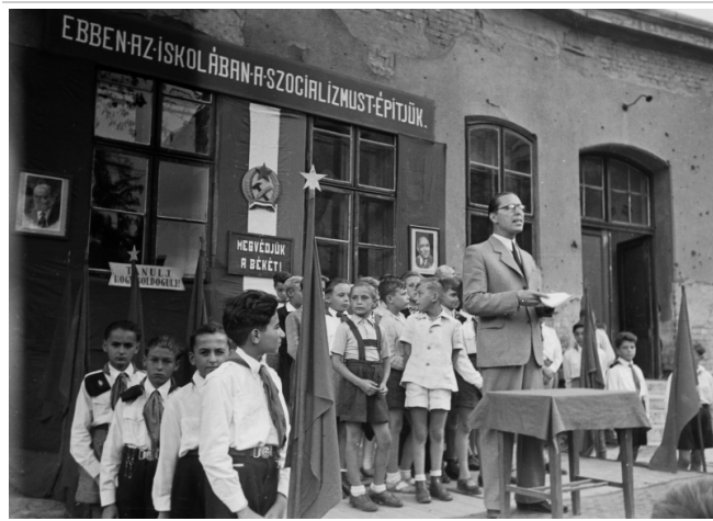
A Hermina út 23. Általános Iskola udvara (1949)