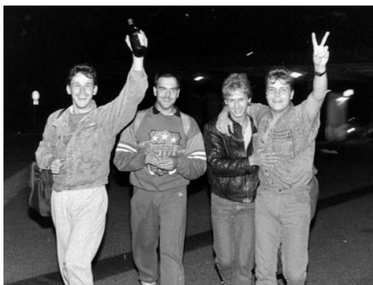
Boldog keletnémet menekültek a hegyeshalmi magyar-osztrák határátkelőnél 1989. szeptember 11-én hajnalban

Augusztus 25-én a Bonn melletti gymnichi kastélyban szigorúan titkos tárgyalások zajlottak a nyugatnémet kancellár és a magyar miniszterelnök, valamint a két külügyminiszter között. A megbeszéléseknek a menekültügyet érintő fejezeteiről nem készült a szokásoknak megfelelő diplomáciai feljegyzés. Az elhangzottakat utólag Hans-Dietrich Genscher külügyminiszter rögzítette a kancellár [popup title="számára" format="Default click" activate="click" close text="Aktén 1998. 1998. 44. A tárgyalásokról Oplatka András részletes és a magyar visszaemlékezéseket is feldolgozó elemzést közöl könyvében. Lásd: OPLATKA 2008.]. Németh Miklós itt állítólóg ígértet tett arra, hogy a menekülteket szeptember 11-én, még a Kereszténydemokrata Unió (CDU) brémai pártkongresszusa előtt Ausztria felé kiengedi az [popup title="országból" format="Default click" activate="click" close text="Uo. A kötet e tekintetben Kovács László visszaemlékezésére támaszkodik.].