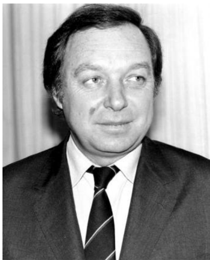
Jean Pierre Hocké, az ENSZ Menekültügyi Főbiztosa

A keletnémet állambiztonság dokumentumai szerint a magyar belügyi szervek, valamint a Külügy- és az Igazságügyi Minisztérium gyakorlatilag csak az NDK belügy-, külügy- és igazságügy-minisztériumának, valamint állambiztonságának ismételt és sürgető, egyre kétségbeesettebb kérdéseinek hatására „kapott észbe.” A Menekültügyi Konvencióhoz való csatlakozásunk részben megoldotta a romániai menekültek ügyét, mindazonáltal tisztázatlan maradt a Magyarországon szintén tiltott határátlépés előkészületével vagy kísérletével elfogott keletnémetek kiadatásának [popup title="kérdése" format="Default click" activate="click" close text="OPLATKA, 2008, 123–128."]. A magyar és a keletnémet állambiztonsági szervek iratai szerint e két, egymást követő és egymást kölcsönösen erősítő esemény - az osztrák határszakasz lebontásának megkezdése és a Genfi Egyezményhez való csatlakozásunk - szélesebb nemzetközi hatása és keletnémet vonatkozása 1989 júniusában teljesen felkészületlenül érte a [popup title="magyar államigazgatást" format="Default click" activate="click" close text="BStU MFS HA IX. Nr. 2450. 83–88."].