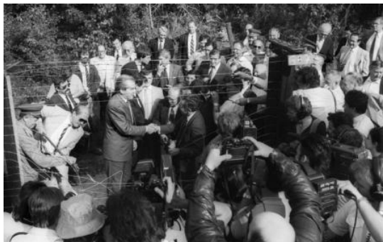
A „vasfüggöny” lebontása

A keletnémet állambiztonság dokumentumai szerint a magyar belügyi szervek, valamint a Külügy- és az Igazságügyi Minisztérium gyakorlatilag csak az NDK belügy-, külügy- és igazságügy-minisztériumának, valamint állambiztonságának ismételt és sürgető, egyre kétségbeesettebb kérdéseinek hatására „kapott észbe.” A Menekültügyi Konvencióhoz való csatlakozásunk részben megoldotta a romániai menekültek ügyét, mindazonáltal tisztázatlan maradt a Magyarországon szintén tiltott határátlépés előkészületével vagy kísérletével elfogott keletnémetek kiadatásának [popup title="kérdése" format="Default click" activate="click" close text="OPLATKA, 2008, 123–128."]. A magyar és a keletnémet állambiztonsági szervek iratai szerint e két, egymást követő és egymást kölcsönösen erősítő esemény - az osztrák határszakasz lebontásának megkezdése és a Genfi Egyezményhez való csatlakozásunk - szélesebb nemzetközi hatása és keletnémet vonatkozása 1989 júniusában teljesen felkészületlenül érte a [popup title="magyar államigazgatást" format="Default click" activate="click" close text="BStU MFS HA IX. Nr. 2450. 83–88."].