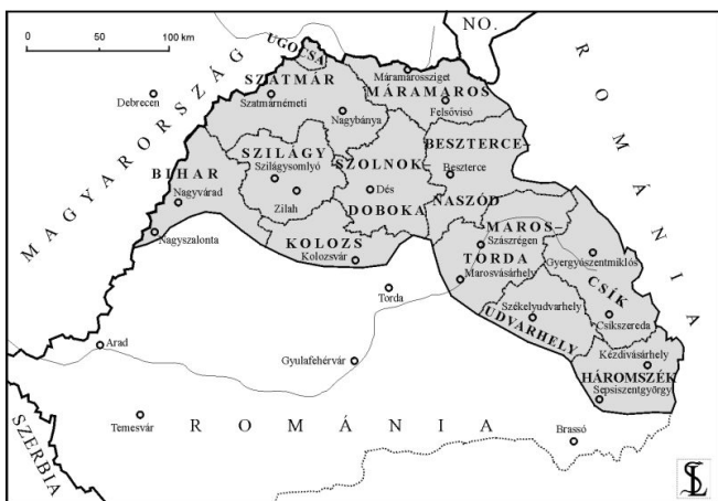
A II. BÉCSI DÖNTÉS UTÁN VISSZACSATOLT ÉSZAK-ERDÉLY

Az 1940. augusztus 30-án meghozott második bécsi döntés - a német érdekeknek megfelelően - kettéosztotta Erdély területét. A kisebb és gyengébb gazdasági mutatókkal rendelkező északi rész Magyarországhoz került, ahol - az 1941-es népszámlálás szerint - a lakosság 53%-a magyarnak vallotta magát. A nagyobb és jobb gazdasági mutatókkal rendelkező déli rész - mintegy félmillió magyar lakossággal - továbbra is Románia részét képezte.