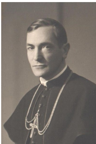
Márton Áron püspök