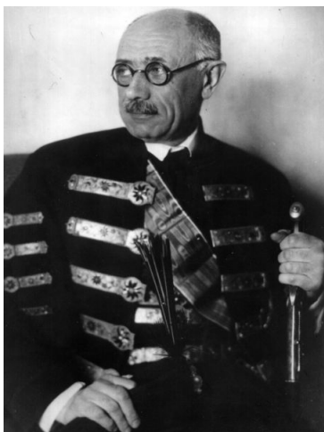
Teleki Pál miniszterelnök

A katonai közigazgatásnak a menekültek tömeges alkalmazásával összetett szándéka lehetett. Mivel ellátásuk 1940 októberétől a katonai közigazgatás feladata volt, egyféle megoldást jelentett, ha a menekült munkához jutott. Másrészt a román lakosság tömeges menekülése miatt tanerőkből és hivatalnokokból nagy hiány mutatkozott, így kézenfekvő volt a menekült közt választani alkalmas személyeket. Ugyanakkor ezt motiválhatta szociális érzékenység is, és feltehetően a helyi magyar elit is erre biztatta a parancsnokokat.