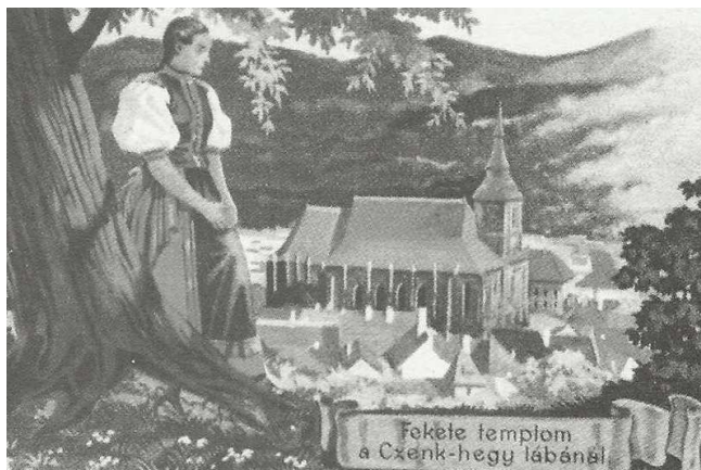
A brassói magyarok továbbra is hiába vártak - revíziós képeslap

Észak- és Dél-Erdély 1940-1944 közötti történelmét alapvetően az ekkor zajló világháborús körülmények, illetve a magyar és a román kormány Erdély teljes területének megszerzése érdekében tett erőfeszítései határozták meg. A két kormány által folytatott nemzetiségpolitika alapja a reciprocitás elve volt, amely szerint a dél-erdélyi magyar lakosság helyzetét alapvetően az észak-erdélyi román lakosság helyzete határozta meg. Az egyre szűkülő lehetőségek miatt mindkét kormány túszként tekintett a saját területén élő nemzetiségekre, így ezek helyzete folyamatosan romlott.