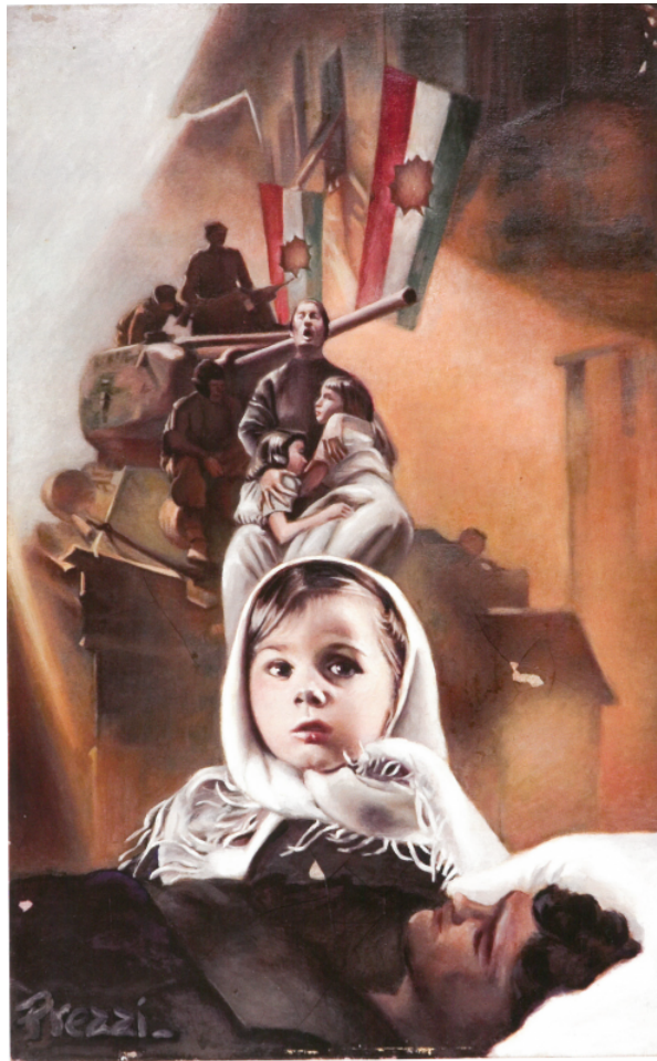
Vilma Maria Prezzi allegorikus festménye 1956-os témában AHF Művészeti Gyűjteménye, Robert G. Grey, 1957-es ajándéka

1959-ben az alapítvány New Jersey államba tette át székhelyét, ahol a Rutgers Egyetem kínált továbbfejlesztést a magyar program számára. A költözés nyomán a magyar tanulmányok biztosítása céljából hozták létre ekkor az American Hungarian Institute-ot (Amerikai Magyar Intézet). A program támogatására az alapítvány 1962-ig összességében 20 000 dollárt gyűjtött össze. A további nagyszabású tervek között szerepelt egy állandó magyar tanszék létrehozása, valamint a gyűjteményt befogadó épület felhúzása is, amiért az alapítvány országos kampányba kezdett.