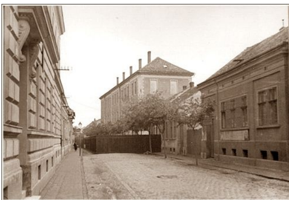
A gettó kerítése

Nem sokkal ezt követően kezdődött meg a gettók felszámolása, a gyűjtőtáborok felállítása és a deportálás. A környező települések zsidóságával együtt a debreceni gettók lakóit június végén a városi téglagyárba zsúfolták össze, majd a magyar hatóságok több mint 10 000 embert deportáltak Debrecenből Auschwitz-Birkenaubába, illetve ausztriai munkatáborokba.[5]