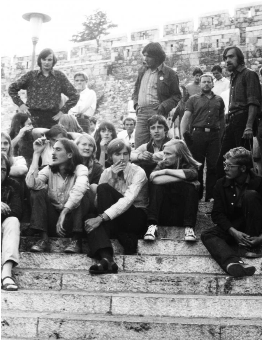
Fiatalok és a Budai Ifjúsági Park - amikor a cigarettázás még nem volt bűn

Radics nyíltan beszélt arról, hogy a titkosszolgálat emberei is jelen voltak a koncertjein. Indián szív-lélek emberként jellemezte őt. Radics egy-egy fellépéséért csak 150 Ft-os gázsikat kapott, ami Indián szerint arra volt csak elég, hogy aznap este jól érezze magát, így nem tudott magának korszerű zenészfelszerelést vásárolni. Indián a koncertjein egy füzetet járt körbe, gyűjtötte neki a pénzt, és felírta, ki mennyit adakozott. Az így összegyűlt pénzből tudta aztán Radics Béla megvenni például az erősítőt. (Lásd az 5. számú dokumentumot!)