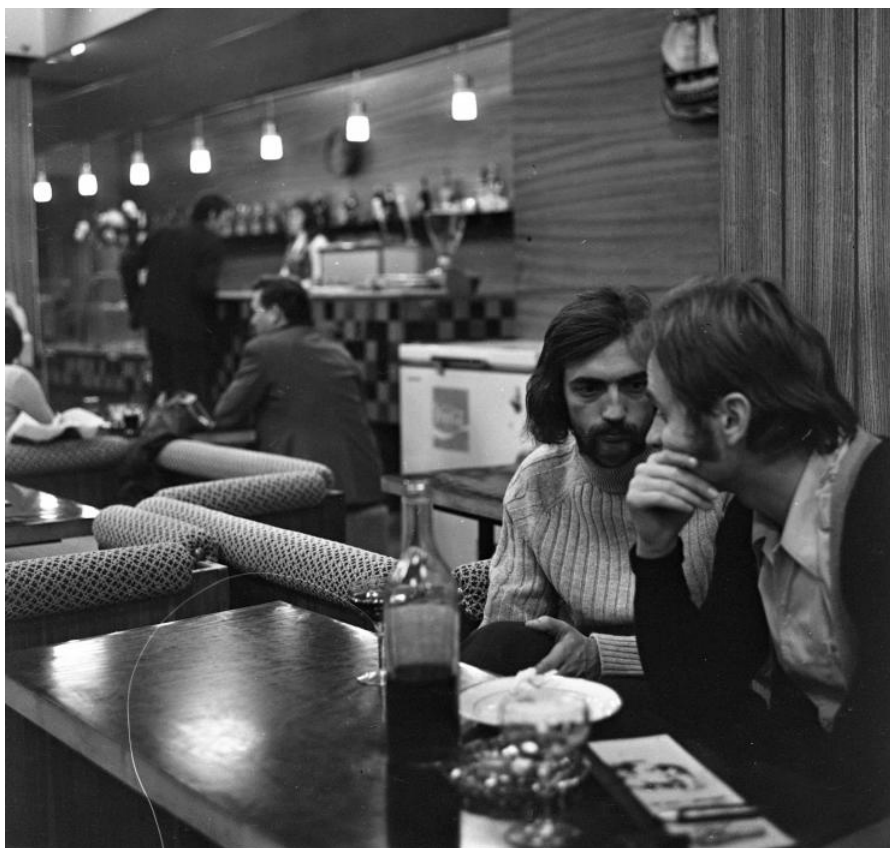
Hosszú haj, presszó, hippiszabadságérzés - a 70-es évek elején Magyarországon

Bár Magyarországon cenzúrahivatal nem volt, az újságírók számára egyértelműnek számított, mely témákról írhatnak, és melyek tabuk. Ha a párt központi lapjában, a Népszabadságban megjelent egy cikk egy jelenségről, az zöld utat jelentett a többi sajtómunkás számára is, azaz írhattak róla. Így történt ez az először „hippie”-ként aposztrofált jelenség bemutatásánál is. (Lásd az 1., 2., 3., 4. számú dokumentumot!)