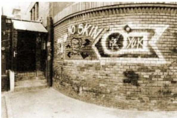
A Fekete Lyuk nevű szórakozóhely bejárata

Megjegyzésre érdemes, hogy az akkoriban már működő Fekete Lyuk nevű szórakozóhelyet rendszeresen „meglátogatták” a kopaszok, és igyekeztek, többnyire ököllel, megzavarni a punk koncerteket.