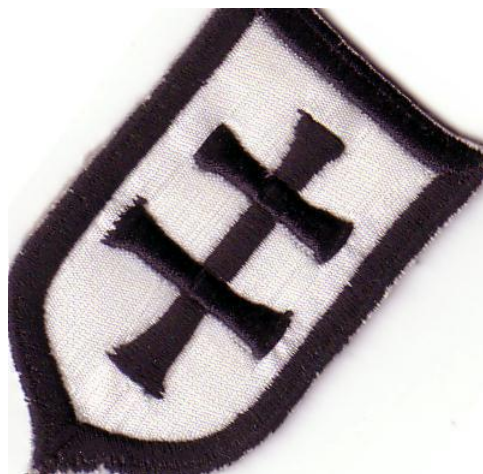
Pannon Skins felvarró

Mindemellett külön felfigyeltek a Pannon Skinsre. Az állambiztonság a következőt vélte tudni róluk: „a fővárosi skin-head-ek reprezentáns csoportja az ún. Pannon Skins csoport. Többoldalú, ellenőrzött, bizalmas és nyílt úton keltekezett információink szerint e csoportosulás a legagresszívabb, potenciálisan a legveszélyesebb.” [11] A Pannon Skins valójában egy elitgárda akart lenni az idősebb, magukat vezetőnek valló kopaszokból, külső jelzésekkel is megkülönböztetve magukat az újonnan skinheaddéváló forrófejű ifjonctól. Ilyen néven zenekar is alakult – egy katonai behívó miatt szünetelő Oi-kor zenekar helyett –, és egy tuat felvarró is legyártottak. A metróbálhá miatt azonban a szervezkedés abbamaradt. [12]