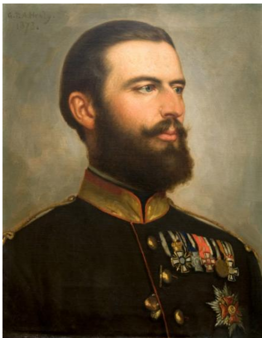
I. Károly román király portréja Festő: George P. A. Healy, 1873 [2]

Ismeretes, hogy az 1878-ban, a berlini kongresszuson török vazallusból független államként elismert és 1881-ben Hohenzollern-Sigmaringen Károly [7] jogára alatt királlyá vált Romániában egyre erősödött az akkor már 56%-ban román többségű Erdély és a Partium megszerzésének a vágya. [8] Ennek azonban a politikai és katonai erőviszonyok alapján az osztrák–magyar nagyhatalom ellenében semmi esélye nem volt – hacsak egy általános európai háborúban a Monarchia nem szenved teljes vereséget. Ráadásul 1883-tól Romániát titkos szövetség kapcsolta a német–olasz–osztrák–magyar Hármasszövetséghez. A világháború 1914. júliusi kitörésével azonban elérkezett a kedvező pillanat a román irredenta álmok megvalósulásához. Károly király szándékával ellentétben Románia nem csatlakozott a Központi Hatalmakkhoz (a szerződés is csak a Monarchia megtámadása esetén írta ezt elő) és a semlegességet választotta azzal a szándékkal, hogy alkalmas időben a többet ígérő táborhoz csatlakozva valósítsa meg területi igényeinek legalább egy részét. Oroszország már a háború elején felkínálta Romániának Erdélyt, amennyiben az csatlakozik az Antant Hatalmakkhoz.