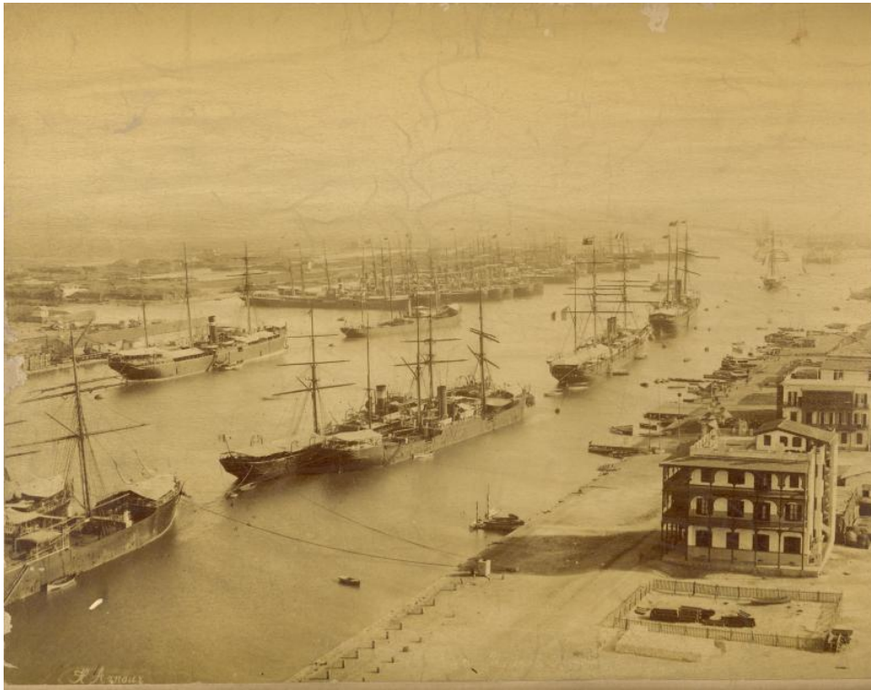
Ismalia kikötője (Egyiptom, 1880-as évek)