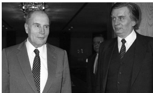
François Mitterrand és Antall József Budapesten, 1990 januárjában

Az 1990. januári elnöki út a két ország kapcsolatainak új alapját teremtette meg, és a kétoldalú kapcsolatok látványosan fejlődni kezdtek. Mitterrand a nyugati és a keleti országok közötti organikus kapcsolatok kiépítéséről beszélt, és a látogatáson találkozott az akkor már a jövő emberének[60] tartott Antall Józseffel ,[61] akivel Európa jövőjéről tartottak megbeszéléseket: „ Antall, de utána Mitterrand is, évezredek perspektívába helyezte a jelen és a jövő Európájának problematikáját. Csak egy kérdésben nem voltak azonos nézetek: Antall a Szovjetunió nyugati határát képzelte el az új Európa keleti határának, míg Mitterrand, aki alig három héttel előbb hirdette meg az európai konföderáció tervét, azt fejtegette, hogy Oroszország nélkül semmi sem lehetséges. ”[62] (Lásd az 5. számú dokumentumot!)