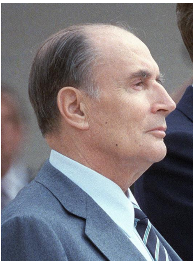
François Mitterrand [2]

François Mitterrand francia elnök [1] 1988. május 8-i újraválasztásával új szakasz kezdődött a francia keleti nyitási politikában. [2] Külpolitikai tanácsadójának, Hubert Védrine-nek [3] így nyilatkozott: „Minden nagyon jól alakul. Itt az idő, hogy elmenjek egész Kelet-Európába, kivéve Romániába, ahova természetesen, ez valószínűtlen”. [4] Magyarország vonatkozásában Franciaország késznek mutatkozott arra, hogy aktívabb szerepet játsszon. Külpolitikai tanácsadójának, Jacques Attali-nak [5] ezzel kapcsolatban így nyilatkozott: „Látványosan Kelet-Európába kell menni. Magyarország éppen most ment keresztül a reformerek által végrehajtott változásokon, amit sürgősen meg kell erősíteni. Javasolni kell nekik egy jelentős pénzügyi és politikai megegyezést, és nem hagyni a [Német] Szövetségi Köztársaságot, hogy ott egyedül cselekedjen.” [6]