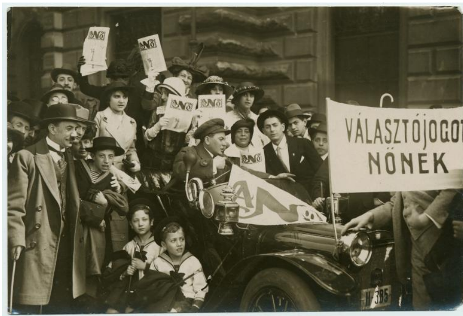
A FE tagsága A Nő és a Társadalom aktuális, IWSA kongresszusra megjelentetett számával 1913 júniusában

A Nő és a Társadalom 1913 decemberéig jutott el olvasóihoz, amikor a FE a júniusi budapesti IWSA-kongresszus szervezéséből fennmaradt 9467,62 koronás anyagi tőkéből A Nő. Feminista Folyóirat címen új, kéthetente megjelenő, olcsóbb, ám immár képmellékletekkel színesített lap alapítása mellett döntött.