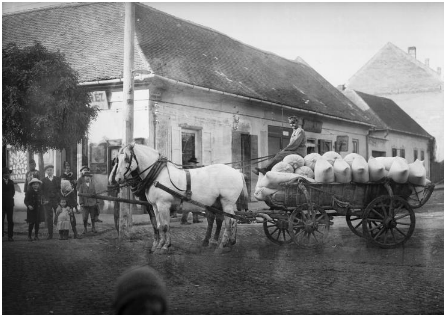
Rekvirált gabona elszállítása

A hadigazdálkodás keretei között az állattartást is szükségszerűen adminisztratív intézkedések láncolata korlátozta, ez azonban közel sem épült ki olyan teljes körűen, és nem járt olyan mérvű jövedelem-elvonással, amint az a közéleti szempontról először számításba jövő gabonafélék esetében bekövetkezett. Jóságrekvirálásra csak 1917 novemberében szánta rá magát a kormány, amikor azt a fokozódó ellátási nehézségek már elkerülhetlenné tették. A katonai és gazdasági összeomlás küszöbén a presztízsében megingott hatalom a „nemzetfenntartó” mezőgazdaság támogatásának végleges elvesztését elkerülendő, az igénybevétel során a hangsúlyt kezdetben az önkéntes felajánlásokra helyezte. Az országos zsrhiány miatt 1918 márciusában elrendelték a négy darabot vágómarhák kirovás útján való hatósági beszerzését. A rekvirálást 1918 tavaszán Vásárhely területére is kiterjesztették. A szabadforgalmi árak alatt megállapított felterjesztést intézett a miniszterelnökhöz a centralizált sertéshizlálást bevezetni szándékoló rendelet hatálytalanítása végett.[12] Nehezményezték, hogy a tényleges termelő tevékenységért és annak kockázatáért őket megillető haszon egy részét a hízalási rendszer átjuttassa a megítélésük szerint felesleges közvetítők, a profitéhes banktöke kezére. A felzúdulás hatására az illetékesek meghátrálásra kényszerültek.