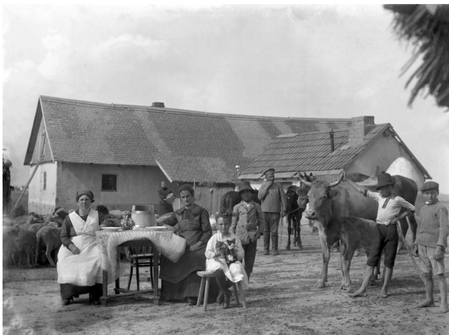
Tanya népe munkára kiadott orosz hadifogollyal

A város gazdaságának jellege és helyi jelentőségű igazgatási funkciója csak viszonylag kisszámú hadkötelest juttathatott a közérdek címén biztosított katonai felmentéshez. Az állandó felmentettekről Vásárhelyen 1916-ban összeállított névjegyzéken 573 fő szerepelt: 44%-ban a mezőgazdaság köréből kerültek ki, a többségük önálló gazdálkodó volt. [6]