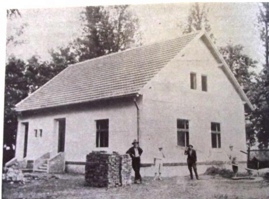
Telepes ház építése