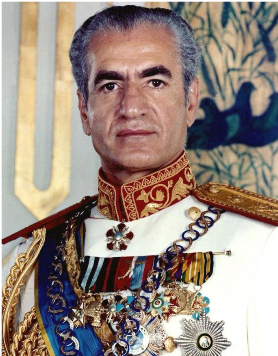
Mohammad Reza Pahlavi iráni sah