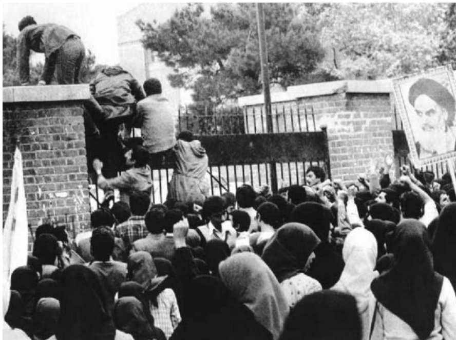
Az Egyesült Államok teheráni nagykövetségének elfoglalása, 1979