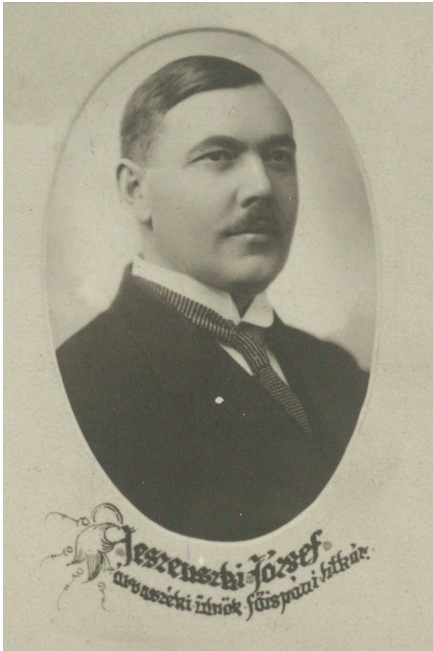
Jeszenszky József arcképe

47 éves korában, 1933. augusztus 17-én hunyt el Szolnokon. [93] Temetésére a szolnoki református temetőben került sor a vármegyei tisztikar jelenlétében. „Szolgálatát becsületes hűséggel, nem csüggedő szorgalommal és kiváló tudással teljesítette és emellett szerény, úri modorával is úgy a közönség megbecsülését, mint kartársai szeretetét méltán kiérdemelte. [94]