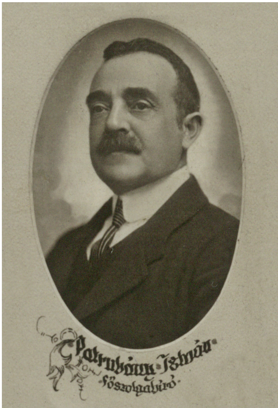
Patrubányi István arcképe