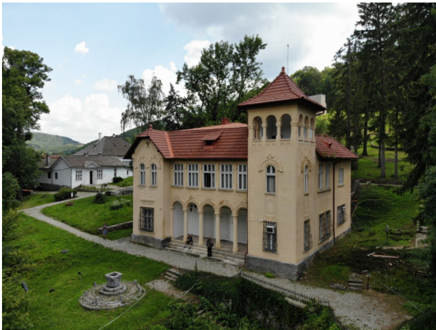
A csucsai kastély – ma az Octavian Gogára emlékező múzeum épülete