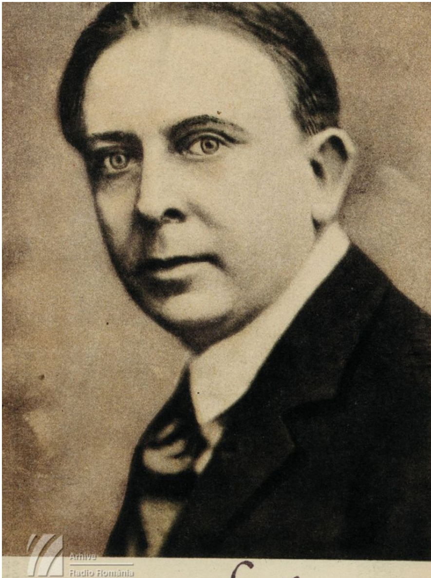
[2] Octavian Goga