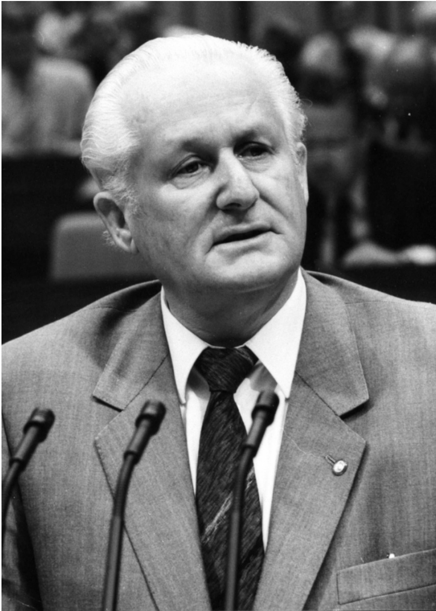
Günter Mittag [2]

Az összeállított keretprogram szerint Berlin Schönefeld repülőtérre kellett megérkeznie a magyar delegációnak. (Lásd a 4. számú dokumentumot!)