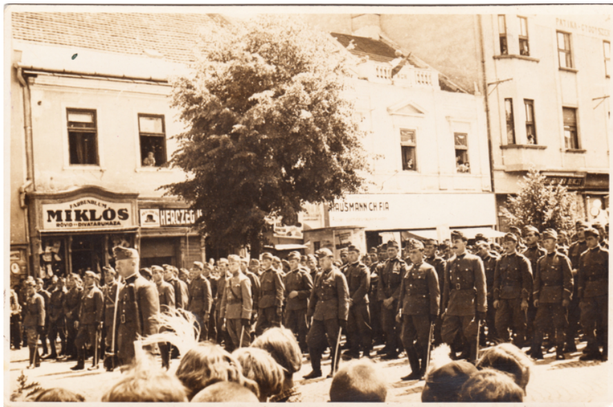
A 12. kerékpáros zászlóalj szlovák újoncainak eskütétele Munkácson 1939 júniusában

A 12. kerékpáros zászlóalj azon alakulatok közé tartozott, amelyeket a Huba I. hadrend[19] keretében állítottak fel 1939. január 23-ával kezdődően. Felállító alakulata a szombathelyi 3. vegyesdandár területéről kiegészített 3. gránátos század, valamint a III. vadász zászlóalj volt. Miután ezen alakulatok személyi állományát főleg Zala és Vas megyéből egészítették ki, így érthető, hogy a 12. kerékpáros zászlóalj tisztii állományának azon része, amely tisztii pályafutását tartalékos állományból továbbszolgáló-próbaszolgálatosként folytatva vált hivatásossá, nagyrészt az említett területről származott (beleértve a napló íróját is). Ez teszi érthetővé a sok utalást, amely Zala megyei településekre vonatkozik. A zászlóalj a Magyarországhoz frissen visszatért Munkácson alakult meg kerékpáros alakulatként, és rövidesen be is vetették őket: 1939. március 15-étől részt vettek a Kárpátalja elfoglalásáért vívott hadműveletekben. Az alakulat rövid életű létezése alatt a honvédség összes műveletében részt vett.[20]