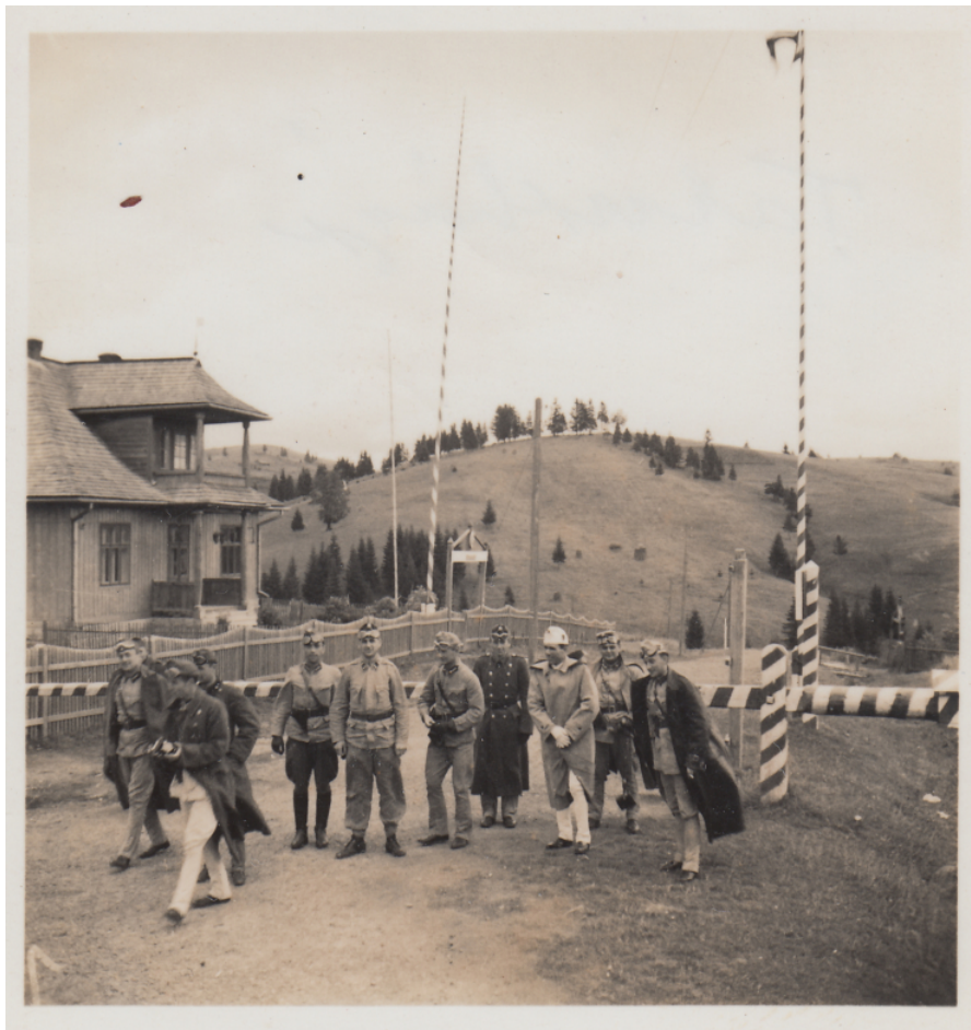
Magyar és lengyel tisztiek a Tatárhágón 1939 nyarán

A 12. kerékpáros zászlóalj azon alakulatok közé tartozott, amelyeket a Huba I. hadrend[19] keretében állítottak fel 1939. január 23-ával kezdődően. Felállító alakulata a szombathelyi 3. vegyesdandár területéről kiegészített 3. gránátos század, valamint a III. vadász zászlóalj volt. Miután ezen alakulatok személyi állományát főleg Zala és Vas megyéből egészítették ki, így érthető, hogy a 12. kerékpáros zászlóalj tisztii állományának azon része, amely tisztii pályafutását tartalékos állományból továbbszolgáló-próbaszolgálatosként folytatva vált hivatásossá, nagyrészt az említett területről származott (beleértve a napló íróját is). Ez teszi érthetővé a sok utalást, amely Zala megyei településekre vonatkozik. A zászlóalj a Magyarországhoz frissen visszatért Munkácson alakult meg kerékpáros alakulatként, és rövidesen be is vetették őket: 1939. március 15-étől részt vettek a Kárpátalja elfoglalásáért vívott hadműveletekben. Az alakulat rövid életű létezése alatt a honvédség összes műveletében részt vett.[20]