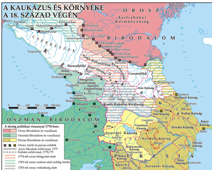
A Kaukázus vidéke és a Karabahi Kánság a 18. század végén