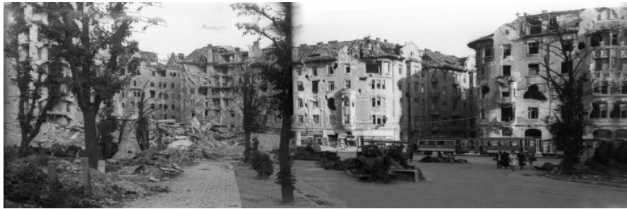
A romos Budapest 1945-ben