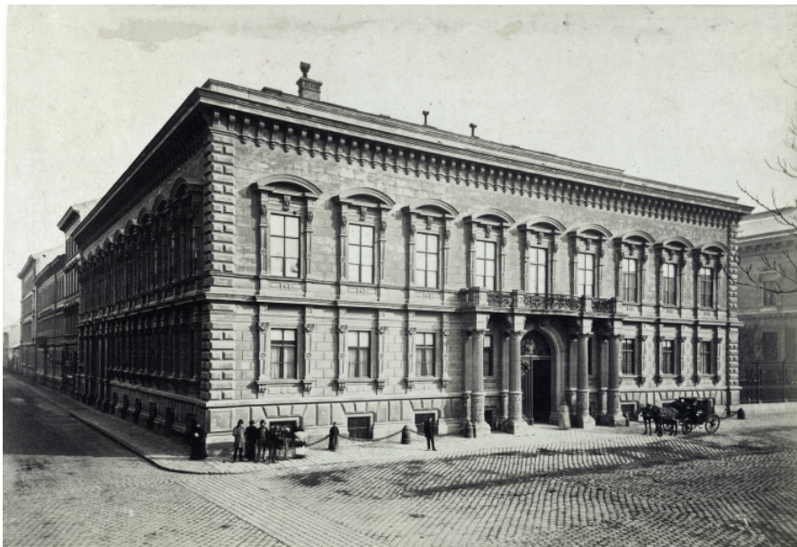
A Festsztics Palota, a későbbi Teleki Intézet székhelye