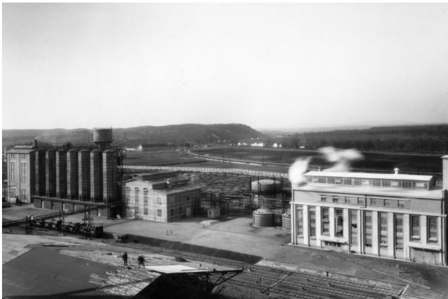
A Péti Nitrogén Műtrágyagyár Rt. mint a „tanyaszerűen” elszórt dunántúli iparosítás példája

Az alföldi nép-főléleg elhelyezésének tehát a módja nem az, hogy a talajjalton ipart erőszakoljuk az alföldi városokban, vagy a földbirtokrendezés során a Dunántúltra telepítjük az alföldi népfelesleget, hanem az, hogy az alföldi munkaerő-tartalékokat bekapcsoljuk a Dunántúli iparosításába. Az iparfejlesztésnek ilyen irányú különösen rokonszenves kell, hogy legyen azok előtt, akik orosz mintákra szeretnek hivatkozni, hiszen közismert, hogy Oroszországban az új iparosodás milyen népesedési eltolódásokkal járt. Ez természetesen nem jelenti azt, hogy olyan iparágak létesítését, amelyeknek előfeltételei alföldi városainkban is megvannak, ne kellene előmozdítani.