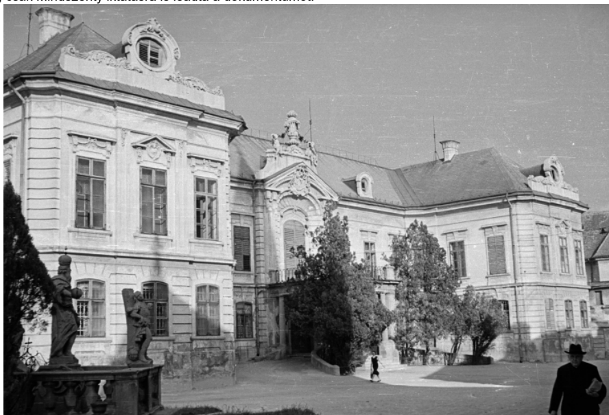
A veszprémi püspöki palota egy 1957-es képen, ahol a forrást őrzik

A Veszprémi Főegyházmegyei Levéltárban a püspöki kancellária iktatott iratai között található az a gépelt irat, amelynek sem a szerzője, sem a címe nem ismert.[1] A fentebbi cím az Egyházmegyei Hatóság iktatókönyvében olvasható, a dokumentum elején csak a szerény „feljegyzés” megjelölést találjuk.[2] A dokumentum szerzője áttekintést ad a kommunista területfejlesztési politika vízióiról. Arra, hogy miért éppen Veszprémben került elő e dokumentum, magyarázat lehet, hogy annak szerzője a közéletben karakteres antikommunista álláspontot képviselő Mindszenty József veszprémi püspököt kívánta tájékoztatni a jövő egyik lehetséges, s az idő által sok tekintetben igazolt forgatókönyvéről. Természetesen az is elképzelhető, hogy a feljegyzés – például valamelyik püspöki kari tanácskozás alkalmával – más főpapokhoz is eljutott, csak Mindszenty iktatására is leadta a dokumentumot.