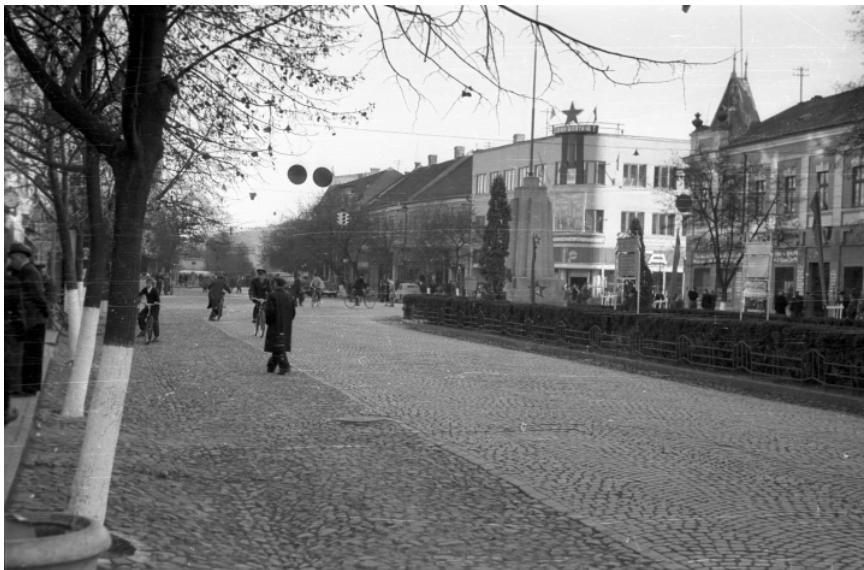
A munkácsi Ciri és Metód tér (Fő utca) 1957-ben