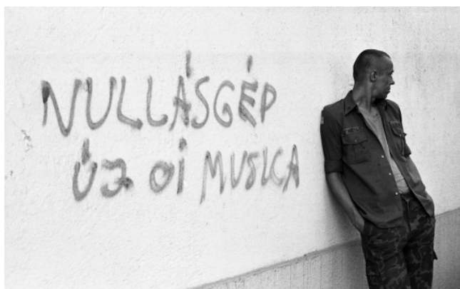
Fortepan / Urbán Tamás [3]

Jelen forrásközlésben a hatósági eljárás során összegyűjtött skinhead dalokat és a hatóságok látókörébe került fiatalok társadalmi háttérét mutatom be. A kiválasztott forrásrészletek jellemző családi helyzetekről szólnak. Közlöm az elsőrendű vádlottnak a bírósági tárgyaláson tett tanúvallomását is. A skinhead dalok, mivel az eljárás során bizonyítékként szerepeltek, szétszórva voltak az iratanyagban, ezeket összegyűjtöttem és rendszereztem.