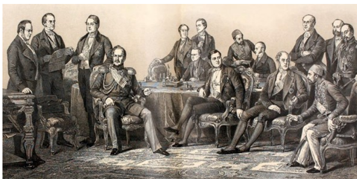
Az 1856. évi párizsi kongresszus.

Ebben a forrásközlésben a dualista Osztrák-Magyar Monarchia és az Európai Dunabizottság (1856-1917) közötti hivatali érintkezések[3] közül kerülnek ismertetésre ügyiratok. A dokumentumok a korabeli nemzetközi szervezetek irányába folytatott ügyvitel mellett betekintést nyújtanak a közös külügyi orgánumok eljárása mögötti hivatali munkálatokba, egyúttal a két birodalomfél szaktárcáinak kívülről nem látható befolyására.