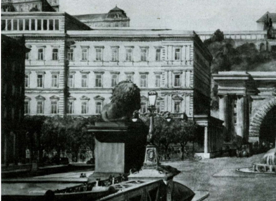
Az egykori M. Kir. Kereskedelemügyi Minisztérium épülete a Clark Ádám téren.

A kereskedelmi minisztériumok ezen befolyását az 1867. évi közjogi kiegyezés tette lehetővé. Az 1867. évi törvénycikk 8. §-a kimondta, hogy a Pragmatica Sanctioból folyó közös és együttes védelem eszköze a külügyek célszerű vezetése, a birodalom diplomáciai és a kereskedelmi képviseltése, amelyet a külügyminiszter a két fél minisztériumával (kormányával) – külpolitikai ügyekben a külügyminisztérium általában a miniszterelnökökkel érintkezik – egyetértésben és azok beleegyezése mellett végez.[12] Az Európai Dunabizottság az európai kormányok delegáltjaiból álló galaci közgyűlés felügyelete alatt állt, egyúttal az európai hatalmi politika eszközeként, az európai koncert intézményeként működött. Mindemellett a bizottságot az 1815. évi bécsi kongresszus elvei alapján, az 1856. évi párizsi kongresszus hozta létre és európai kongresszusok szabályozták (1858, 1866, 1871, 1878, 1881, 1883). Bár a fenti történeti ívből kiindulva joggal vélhetjük, hogy az Európai Dunabizottságban egy a közös ügyek körébe tartozó diplomáciai karakter mutatkozik meg, mégis azt látjuk, hogy az osztrák és magyar kereskedelemügyi minisztériumok befolyása az EDB-t illető külügyekre közvetlen.