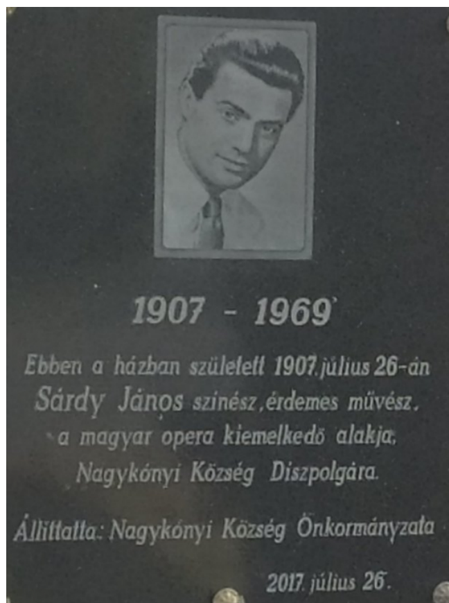
Sárdy János színész, énekes születésének 110. évfordulóján szülőháza falán emléktáblát avattak

A frissen végzett, húszéves fiatalember 1927-ben nyerte el a Dunaföldvár község kántortanítói állását, miután az előző tanító, Kiss Ferenc lemondott, és így megüresedett a hely. A dunaföldvári római katolikus iskolaszék 1927. szeptember 25-én tartott gyűlésén választották meg az ifjú Sárdy Jánost a Dunaföldvári római katolikus elemi népiskola kántortanítójává, akinek így élete visszakanyarodott tágabb szülőföldjére, Tolna megyébe.[5] (lásd 1. sz. dokumentum)