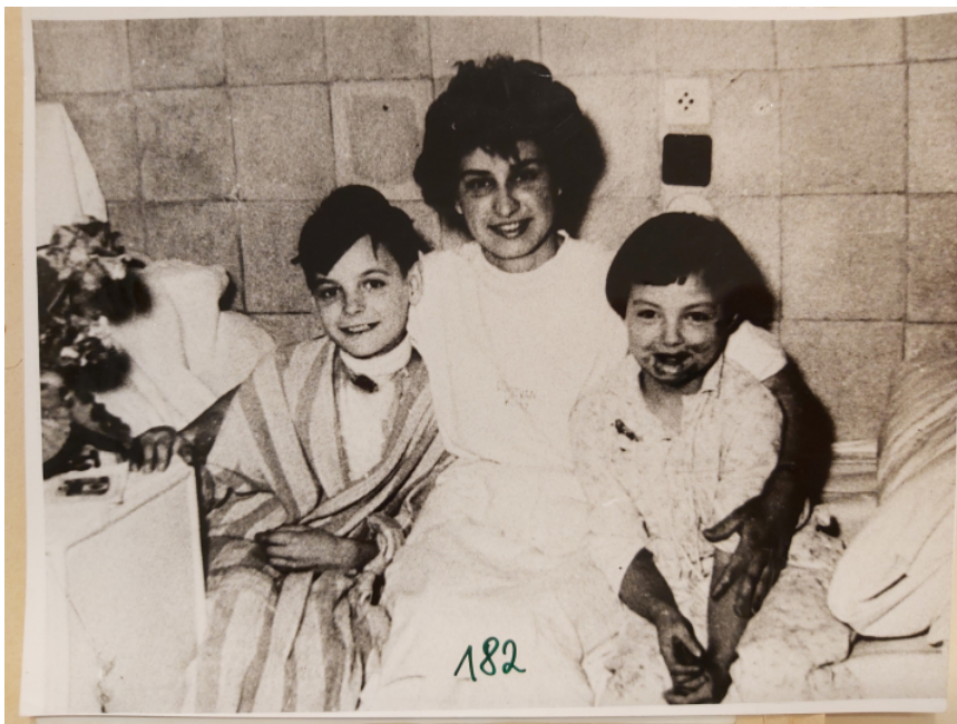
A két túlélő sértett gyermek és egy nővér, 1962 [2]

Az alábbiakban a jogerős bírósági határozat alapján idézek az elsőfokú bíróság által megállapított tényállásból, a Legfelsőbb Bíróság által jogerőre emelt ítéletből, [5] annak indoklásából, valamint az elítélt kegyelmi kérvényének elutasításához kapcsolódó dokumentumokból. A bűntetőügyben keletkezett releváns iratokat a Budapest Főváros Levéltára őrzi. [6]