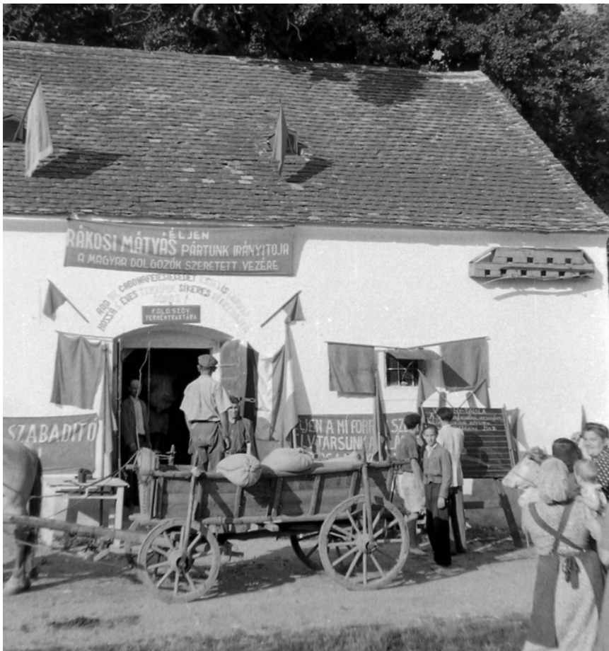
1950. Terményraktár, beszállítás. [2]

A Rákosi-korszak éveiben, de legfőképpen az ötvenes évek elején, amikor az agrárpolitika végrehajtását a keményvonalas irányzat határozta meg, a beszállítási rendszer évről-évre változott. A termelőkre kivetett kvótákat évről-évre emelték, a birtokhatárt, ameddig a rendszer kiterjedt, pedig csökkentették. [5] A parasztság ilyen módon történő sanyargatása az élelmiszertermelésben és -ellátásban is zavarokat okozott. Ráadásul 1952-ben rendkívül kedvezőtlen volt az időjárás, legfőképpen az aszály volt negatív hatással a termelésre. [6] 1952 júliusában döntés született arról, hogy a tömeges kollektivizálást elhalasztják, és hogy később fogják azzal összekapcsolni a kulákság likvidálását hivatallósá tenni. [7] A termelés ösztönzésére és az árufelhozatal növelésére már korábban, 1951-ben történt intézkedés úgy, hogy bizonyos mezőgazdasági termékek forgalmát felszabadították. [8] A parasztok a beszállítási kötelezettség teljesítése után árufeleslegeikkel szabadon rendelkezettek.