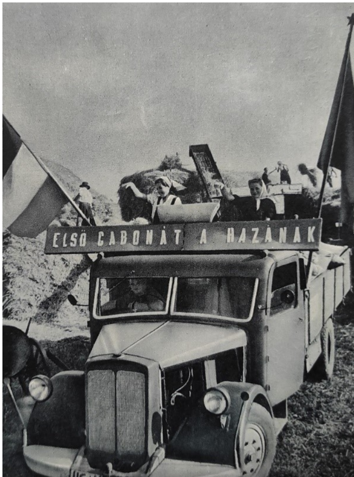
Pontos dátum és hely nélküli fotó. Jelzet: MNL GyMSMGyL XXIII. 15.a. 12. doboz.

[10] 1953 első felében általános jelenség volt az, hogy az emberek vidéken és a városokban sorban álltak kenyérért és egyéb közszükségleti cikkekért a boltoknál. [11]