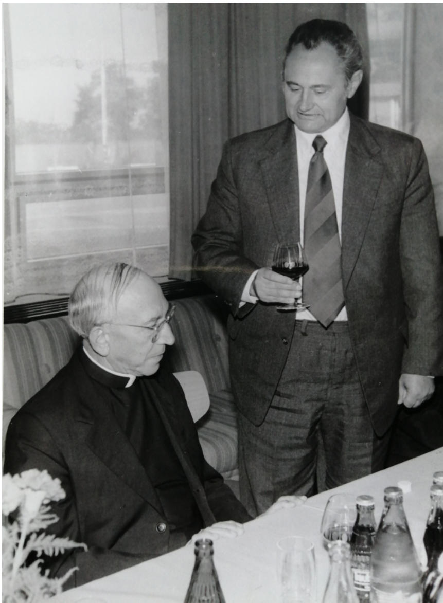
Mons. Agostini Casaroli köszöntése egy budapesti tárgyalásán.