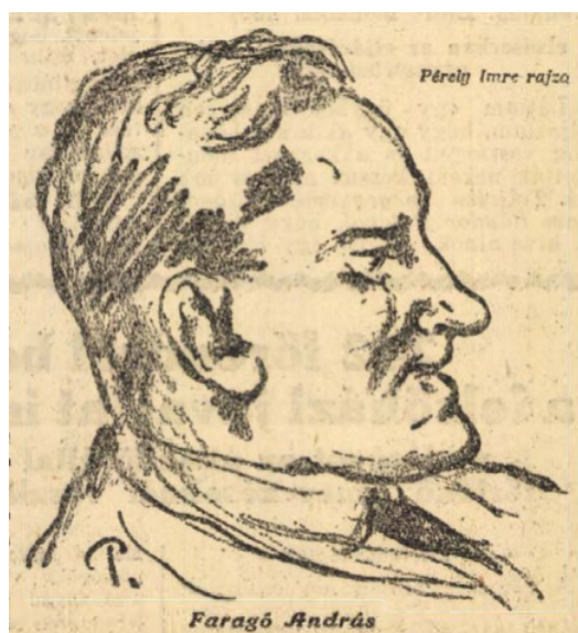
Az Est, 1925. március 13. 8.

A Faragó Andrásról szóló tudósítások pedig a személyes adatok nyilvánosságra hozásával, a regényes elemek szerepeltetésével, irodalmi ábrázolásmóddal a vizsgált korszakban sem tekinthetők elfogulatlannak. A cikkek tartalmán túl már a szalagcímek is erre utaltak ( A párisi házasságszedelgő somogyi szereplése; Lefülették Faragó András, a híres nemzetközi szélhámost; Magyar ékszerablók Párizsban elbódítottak és kifosztottak egy gazdag félvilági hölgyet ). Mindazonáltal a sajtó nyomása és a jogalkalmazás változása közötti közvetlen kapcsolat feltárása nem jelent egyszerű feladatot. Faragó esetében erre utal ugyanakkor jogalkalmazó részéről, hogy a levéltári anyagok között fennmaradt bírósági ítéletben kihúzott részként találkozhatunk Faragó kloroformos rablására vonatkozó utalással, egy 1947-ben (!) kelt elsőfokú büntető ítéletben pedig feltüntették a sajtó által kreált ragadványnevet („ Kloroformos Bandi ”). [44] A bűnüldöző szervek részéről hasonló elemként említhető egy későbbi áldozata törvényszék előtt tett vallomásaiban szereplő megjegyzés, miszerint „ a rendőrségen nekem azt mondták, hogy 25-öt kellene a fenekemre verni, amiért ilyen embernek adok hitelt ”. [45]