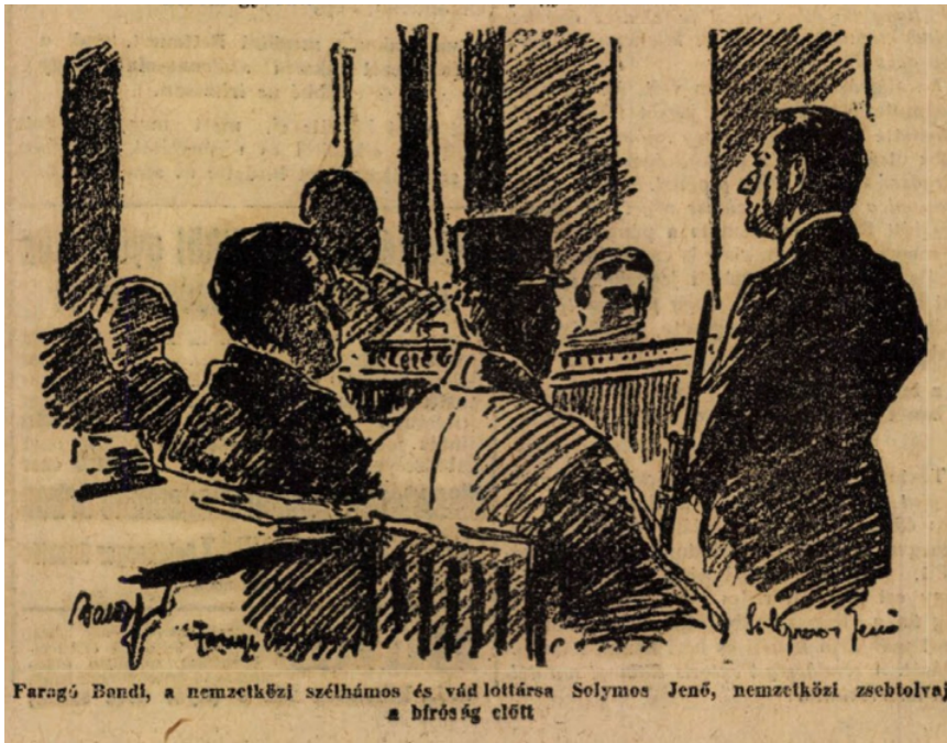
Esti Kurír , 1925. március 12. 5.