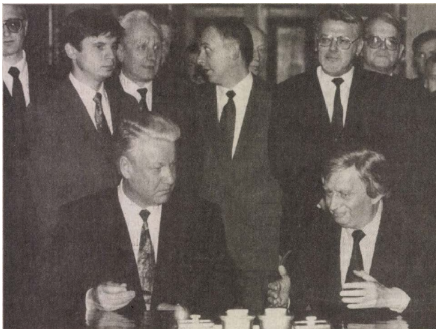
Borisz Jelcin és Antall József 1992. november 11-én. [2]

Dokumentumaink elsődleges kontextusa és kiindulópontja Borisz Jelcin fent már említett 1992. november 11–12-i hivatalos magyarországi vizitjének háttére, annak történései és főbb konzekvenciái. Sáringer János monumentális diplomáciatörténeti sorozatának III/2. számú kötetében közli az Antall József magyar miniszterelnök és Borisz Jelcin közötti november 12-i kétoldali megbeszéléséről készített feljegyzést. A magyar kormányfő a tárgyalás legvégére hagyva hozta fel, hogy kötelességének érzi átadni az orosz államelnök számára a Bajcsy-Zsilinszky Társaság (BZST) által utóbbi nevére címzett memorandumát, melyben az 1946-ban egy moszkvai börtönben elhunyt Bethlen István földi maradványai hazaszállításának az elősegítését kéri az orosz féltől. Még annyit elmondott, hogy tudomása szerint Bethlent a Lubjankán tartották fogva, s haláláról az 1947-től 1956-ig ugyanott sínylődő Kovács Béla tudósította őket. [4] Elég eklatánsan jellemzi a deszovjetizáció mellett elkötelezett Jelcin habitusát és gondolkodásmódját, hogy mérlegelés nélkül megígérte a segítségét, sőt, kommentálta is a felvetést. Kijelentette, hogy megítélése szerint azt sem lehet kizárni, hogy Bethlent kivégezték, [5] vagyis azt insznuálta, hogy a két világháború közötti magyar politikai élet „Grand Old Man”-je a sztálini represszió áldozata lett.