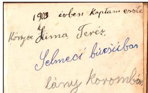
Bejegyzés a könyvben