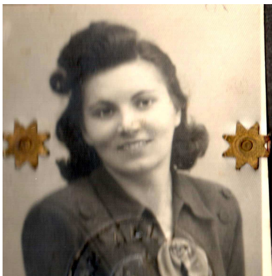
Fiatal kori képe

Az egyesített szövetkezetnél számviteli osztályvezetőként dolgozott egészen 1977. évi nyugdíjazásáig. Nyugdíjasként dolgozott még a helyi tanácsnál, hol Kosd, Penc és Rád községek közműekkel kapcsolatos számlavezetéseit intézte.