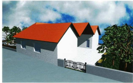
A piac látványterve

terményeiket értékesíthesse. Azt reméljük, hogy mindezek révén bevételhez juthat a termelő és jó minőségű, helyben termelt friss terményekhez juthatnak a vásárlók. A piac a kultúrház épületében és a környező kertjében valósul meg.